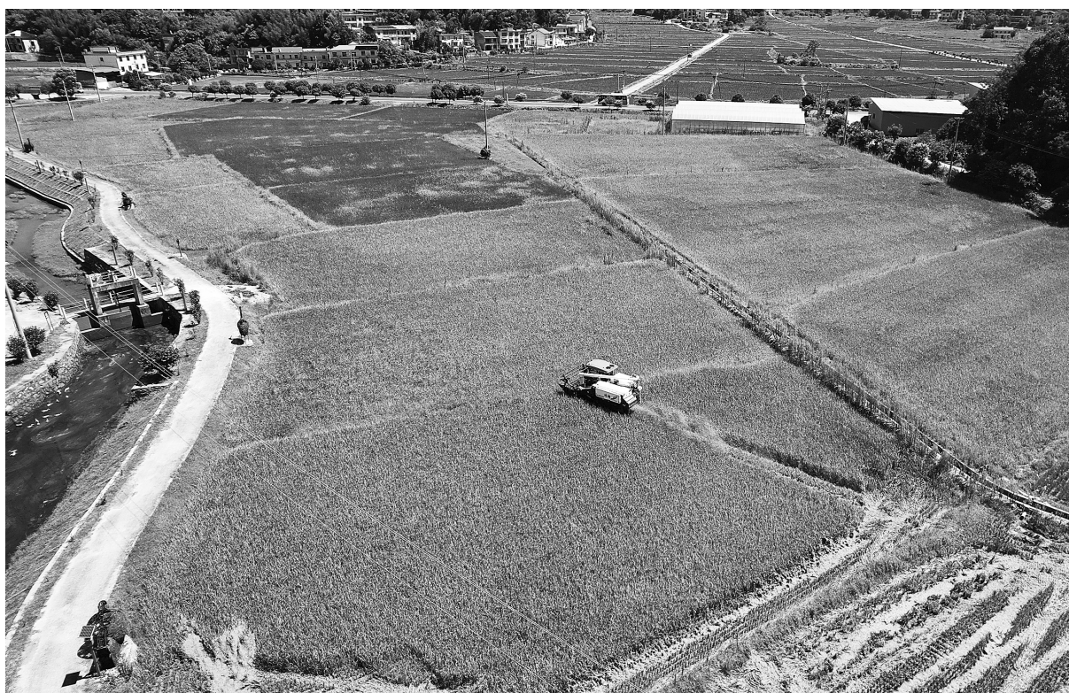
7月22日，萍乡市湘东区排上镇北村村，农机手正驾驶收割机收割早稻。萍乡市早稻陆续进入收获期，当地农户抢抓晴好天气，组织机械抢收早稻，努力实现颗粒归仓。

7月下旬，“双抢”已进入最后关头，智慧农机成为“抢时间”的关键。省农业农村厅农业机械化管理处相关负责人告诉记者，我省通过开展水稻机收减损大宣传、大培训、大比武活动及水稻机收减损监测调查工作，提高机械化作业质量水平，最大限度降低稻谷损失，并全面推广农业社会化服务，帮助农户实现节本增效。据统计，今年，全省各地准备各类“双抢”农机具72.38万台（套），其中大中型拖拉机4.21万台、履带式联合收割机3.46万台、高速插秧机2.11万台。