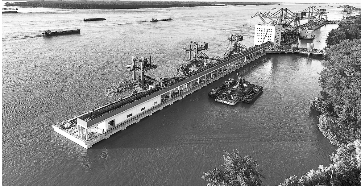
7月22日，九江市红光国际港口银砂湾码头正加紧设备安装调试，全力加速建设。连日来，湖口县紧盯目标任务，科学安排施工，确保项目建设有序推进。

果园管理方面，要积极做好幼树、高接树的支柱绑缚，结果多的果树要架好支架固定树体、撑果，条件允许的还可以造防风网；在风雨来临前喷杀菌药保护果树，避免果实受到病虫害侵袭；前期干旱的果园近期注意少量多次淋水，保持土壤湿润，避免强降雨造成大面积裂果。提前采收已成熟的葡萄、西瓜、桃子等经济林果，未达采收标准的注意防风防雨。