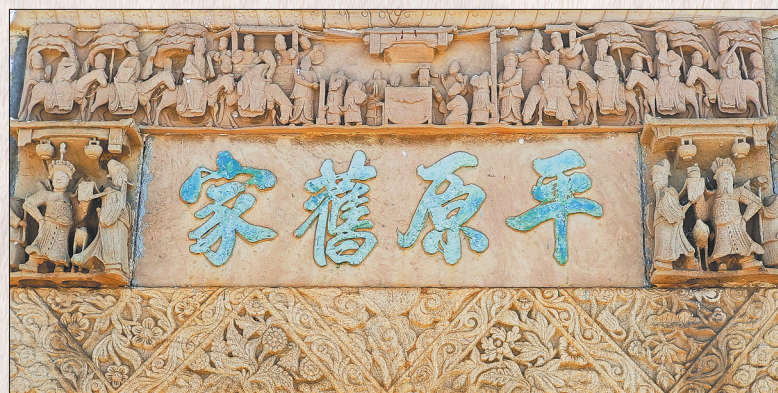
图②：“平原旧家”匾(崇仁县华家村)