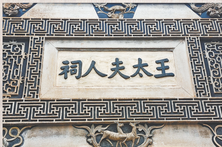
图③：“王太夫人祠”匾(赣县区白鹭村)