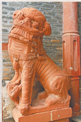
图⑨：石雕《石狮》(青原区洪波村)

每一个古村，都像一个原生态的博物馆。近日，记者走访了江西一些古村，感受到厚重的文化底蕴。庄重精致的官商大宅、恢弘肃穆的祠堂牌楼、清静素雅的书院小屋……古村里的每一座古建筑无不体现出特色鲜明的地域文化。临川文化、庐陵文化、豫章文化、浔阳文化、客家文化等，在相应的村落中，均能找到文化的物化载体，即文化符号。作为古村厚重历史文化之精华，历经岁月风雨仍被保存下来的每一件古代牌匾、楹联以及雕刻、绘画等艺术品，背后都有生动的故事，都承载着一代代村人口口相传的骄傲。