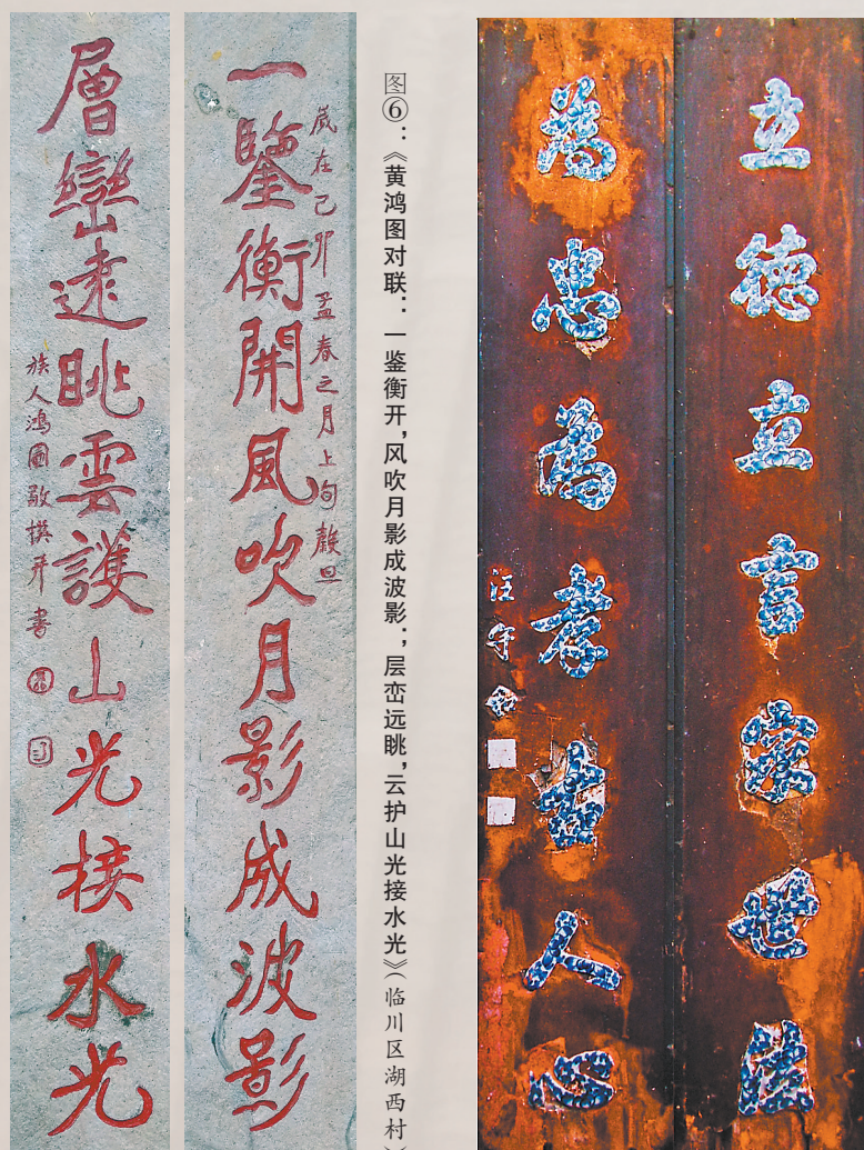
图⑥：《黄鸿图对联：一鉴衡开，风吹月影成波影；层峦远眺，云护山光接水光》(临川区湖西村)