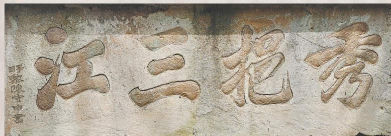
图④：陈守中题“秀挹三江”匾(南昌县三江镇)