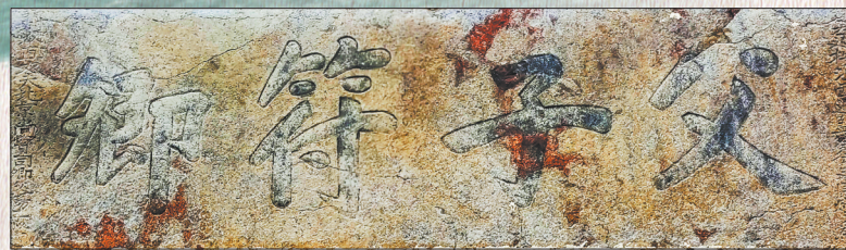
图①：“父子符卿”匾(丰城市白马寨村)