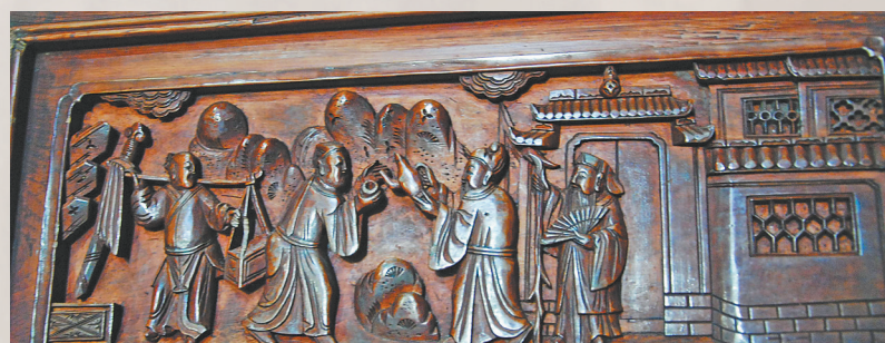
图⑨：木雕《送子赶考》(婺源思溪村)