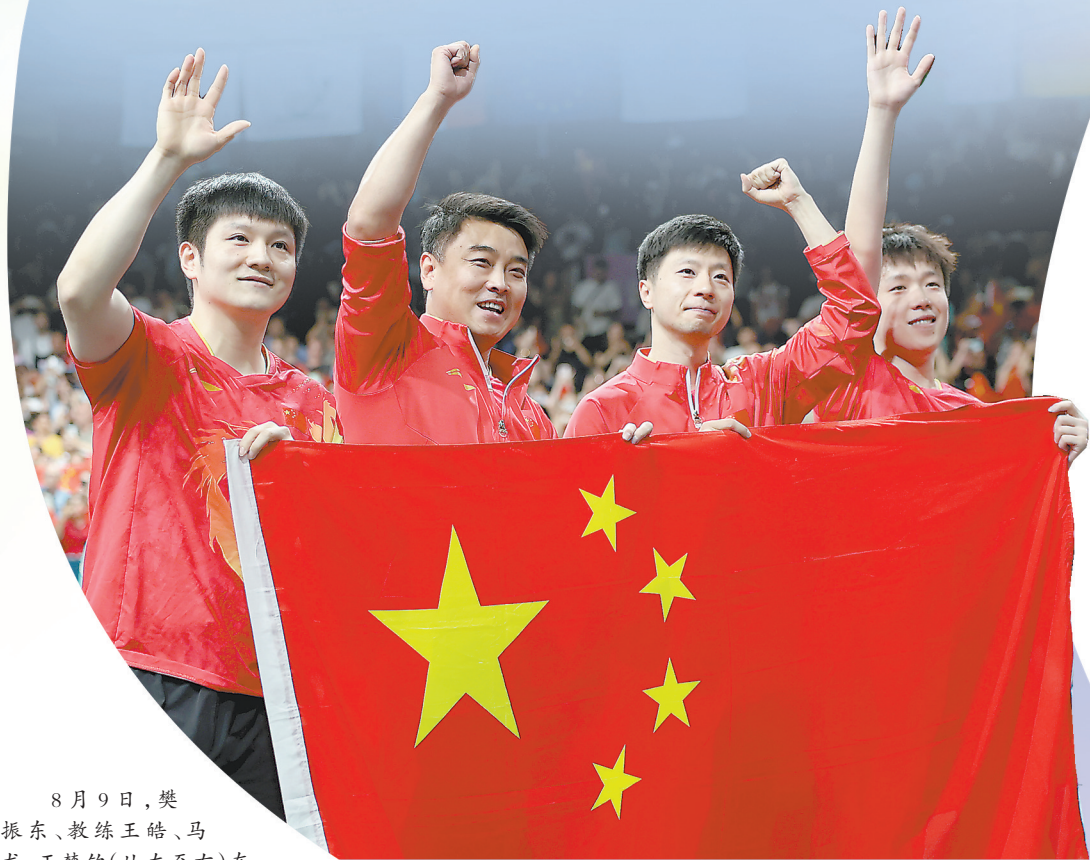
8月9日，樊振东、教练王皓、马龙、王楚钦(从左至右)在夺冠后向观众致意。