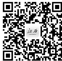
看相关视频 扫二维码