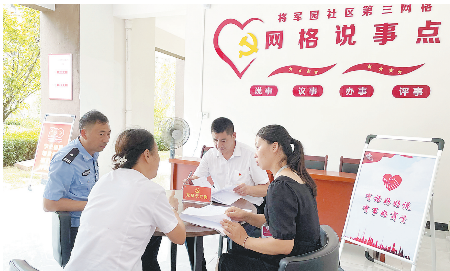
网格说事助理基层治理创新

革工作要点集成化改革任务数177项,完成率100%,充分彰显推动全面深化改革的积极性和创造性。