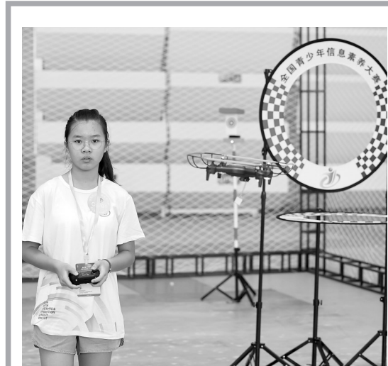
8月17日，选手在参加无人飞行器主题赛。