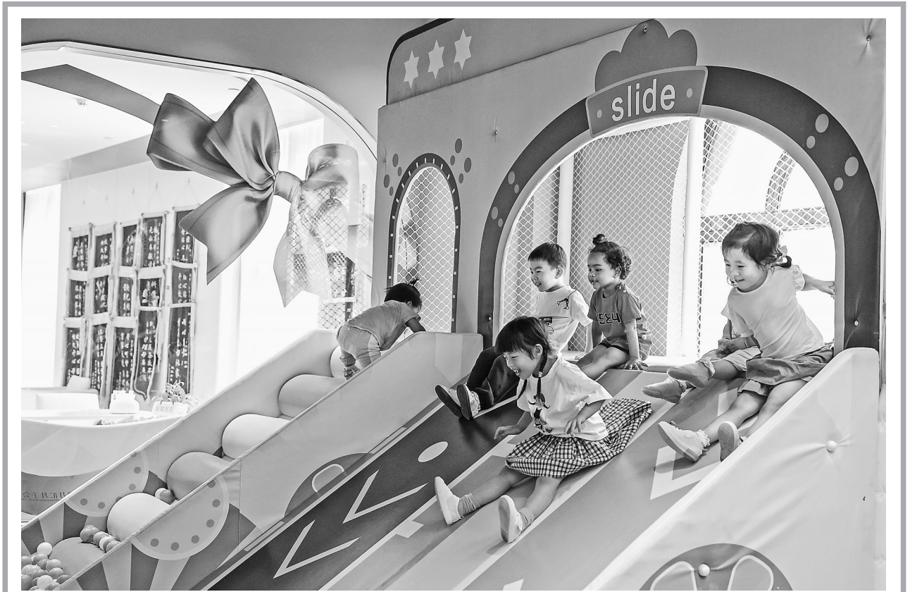
8月20日，在嘉兴市南湖区东栅街道的一家托育机构里，小朋友在活动。

红色初心，烛照千秋，辉映未来。新华社记者 沈虹冰、贺占军、姜辰蓉 (新华社西安8月20日电)