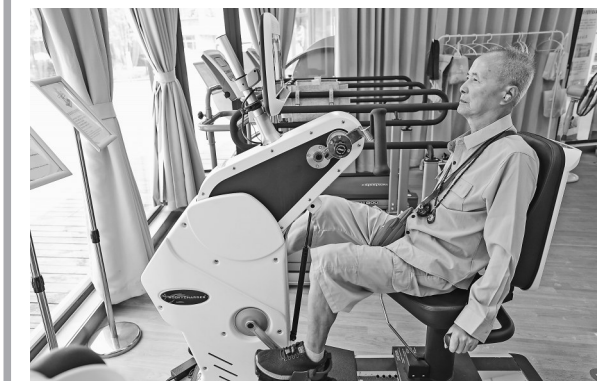
8月20日，老人在嘉兴市南湖区新嘉街道电子社区邻里中心内的“长者运动之家”锻炼。