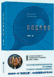
《乒乓球有意思》吴敬平著 上海社会科学院出版社

重困难与挑战,她们没有放弃,反而凭借坚韧不拔的毅力、精诚团结的协作,以及关键时刻的出色发挥,成功逆袭出线,并最终在决赛中力克强敌,站上了最高领奖台,让人们再次感受激动人心的时刻,以及中国女排所展现出的非凡魅力与不朽精神。