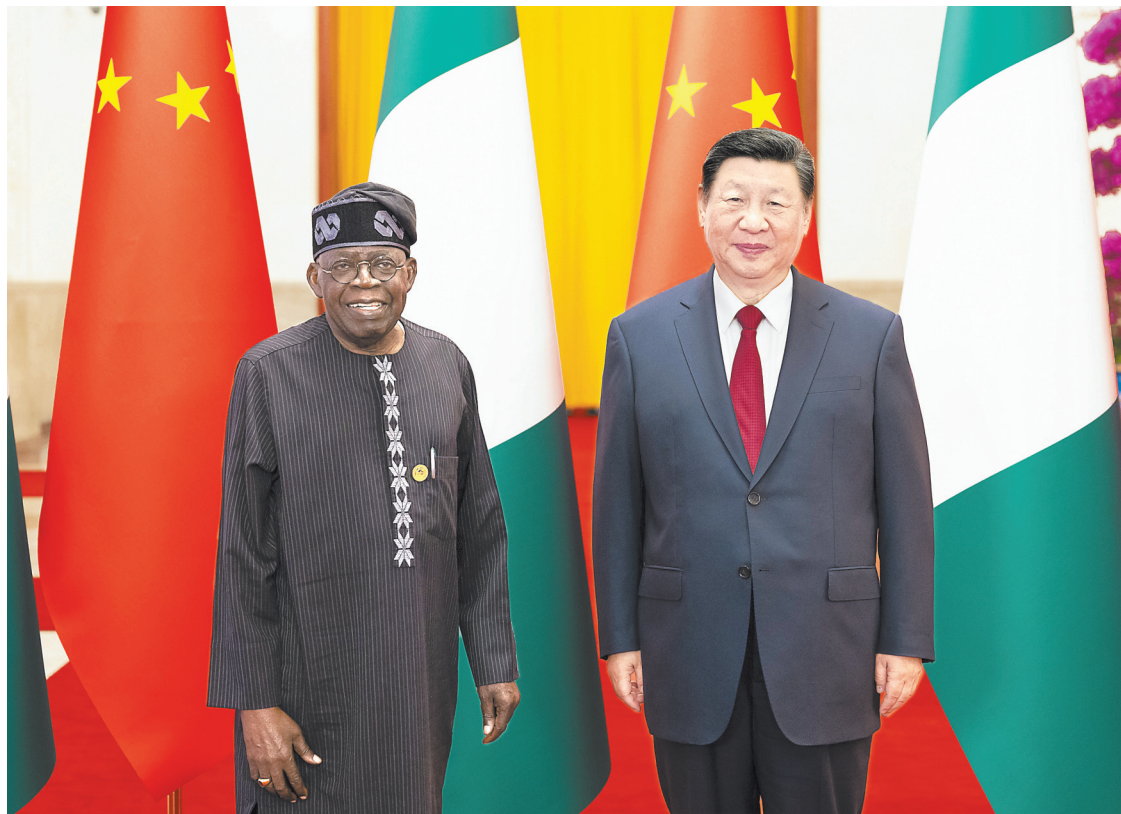
9月3日下午,国家主席习近平在北京人民大会堂同尼日利亚总统提努布举行会谈。

新华社北京9月3日电(记者郑明达、袁睿)9月3日下午,国家主席习近平在北京人民大会堂同津巴布韦总统姆南加古瓦举行会谈。