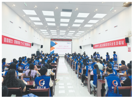
知识竞赛练兵比武活动现场

今年以来,高安市就业中心紧盯工作目标,各项工作成效显著,城镇新增就业4722人,失业人员再就业1574人,就业困难人员就业524人,新增转移农村劳动力8251人,职业技能培训2254人,呈现出质效双升的良好态势。