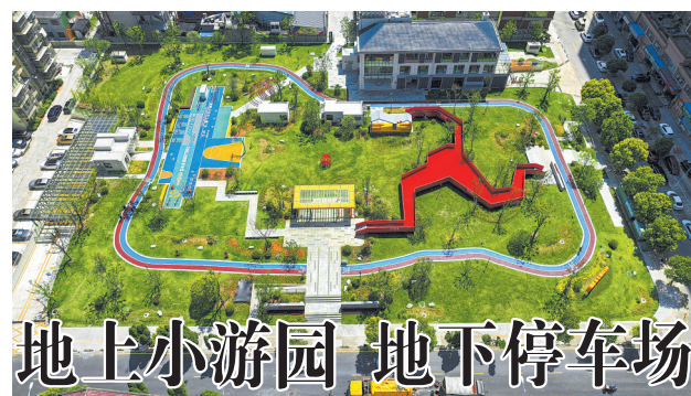
地上小游园 地下停车场

探索医养结合模式。走进秋溪镇,远远就可以看到该镇的健康养老服务中心。该中心总建筑面积3250平方米,设置床位80张,院内设施配套齐全,可满足老年人日常生活的各种需要。临川区积极探索医养结合新型养老模式,引导基层医疗卫生机构及医务人员与养老院建立签约服务关系,鼓励社区医生参与健康养老服务;建立乡镇养老院和卫生院、社区卫生服务中心合作机制,将养老中心建在各乡镇中心卫生院旁边,实现两院融合,不断提升养老院医疗护理服务能力。