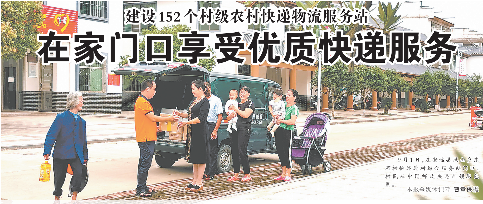
9月1日,在安远县凤山乡东河村快递进村综合服务站点门口,村民从中国邮政快递车领取包裹。