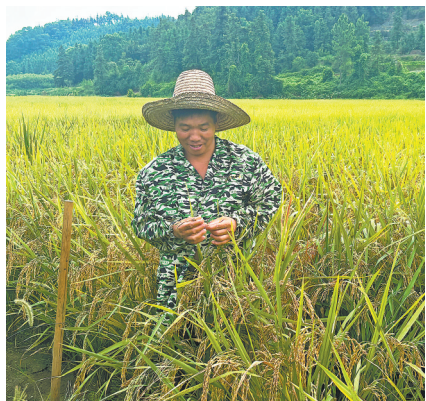
新龙水稻种植基地有机稻长势喜人。本报全媒体记者 侯艺松

稻谷飘香时节,宜春市袁州区芦村镇双江村新龙水稻种植专业合作社的万亩稻花迎来了丰收。