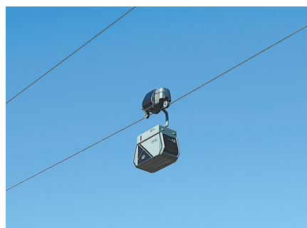
智慧物流运输快线低空索道。

据介绍,智慧物流运输快线是在低空架设钢索,云端系统控制穿梭机器人在索道上运输货物的新型智能化、轻量化、无人化运输系统,通过构建县镇村三级智运快线网络,打通消费品下行“最后一公里”和农产品上行“最初一公里”,让村民足不出村就能享受到优质快递服务。