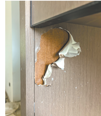
脱皮的玄关柜。

本报全媒体记者 付强 邮箱:307237420@qq.com 微信号:307237420