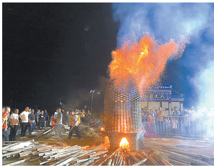
图为安福县洋门乡嘉溪村在举办“中秋烧塔”活动。

夜幕之下，一座被柴火烧红的瓦塔。塔底内，火焰正旺。烧塔师傅不时向灶口添加柴火，顷刻间，塔眼冒出火星如火龙腾飞。围观的男女老少，一片喝彩声。这是中秋之夜，安福县洋门乡嘉溪村国家级非遗“中秋烧塔”习俗表演现场震撼的一幕。