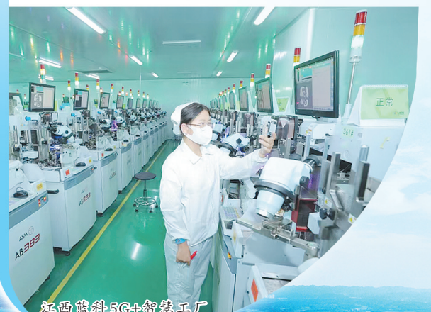
江西蓝科5G+智慧工厂