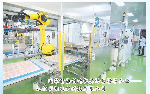
国家智能制造场景标杆企业——九江明阳电路科技有限公司