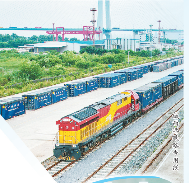
城西港铁路专用线

牢记嘱托, 感恩奋进。“三大攻坚行动”势如破竹, 发展步伐铿锵有力, 九江经开区向上生长的拼劲愈加明显, 阔步走向更加灿烂的明天。