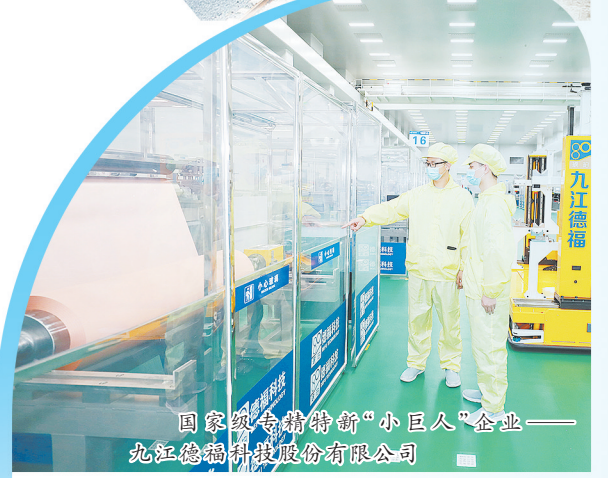
国家级专精特新“小巨人”企业——九江德福科技股份有限公司