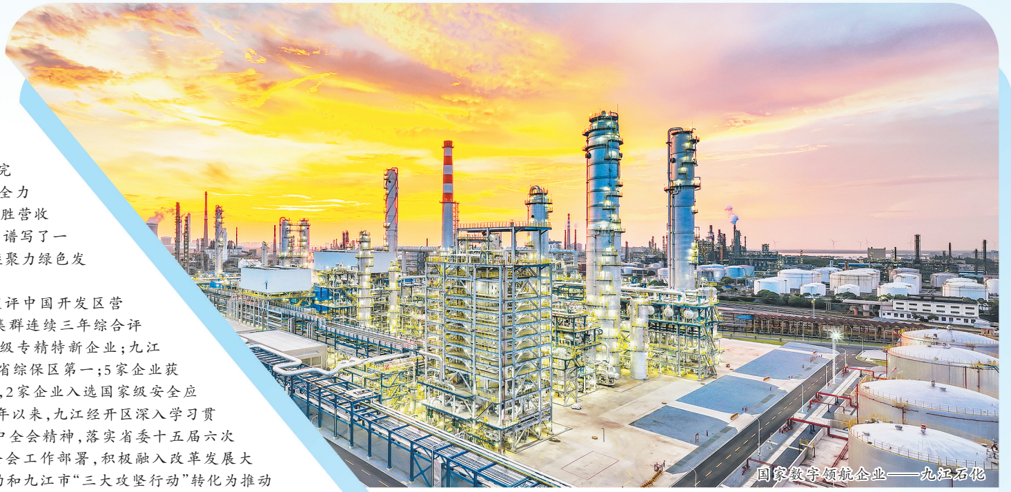
国家级领军企业——九江石化

九江经开区“开心办”平台获评中国开发区营商环境百佳案例; 电子电器产业集群连续三年综合评价获全省优秀等次; 新增17家省级专精特新企业; 九江综保区上半年进出口总量位列全省综保区第一; 5家企业获评国家级专精特新“小巨人”企业, 2家企业入选国家级安全应急装备应用推广典型案例……今年以来, 九江经开区深入学习贯彻党的二十大和二十届二、三中全会精神, 落实省委十五届六次全会和九江市委十二届十二次全会工作部署, 积极融入改革发展大局, 努力把全省“大抓落实年”活动和九江市“三大攻坚行动”转化为推动高质量发展生动实践, 全力开展“强攻项目年”活动, 强攻谋划储备、强攻项目招引、强攻项目建设、强攻要素供应、强攻平台保障、强攻服务管理, 奋力强攻总投资586亿元的69个重大产业项目建设, 持续掀起项目建设大热潮, 为九江高标准高质量建设长江经济带重要节点城市贡献力量。