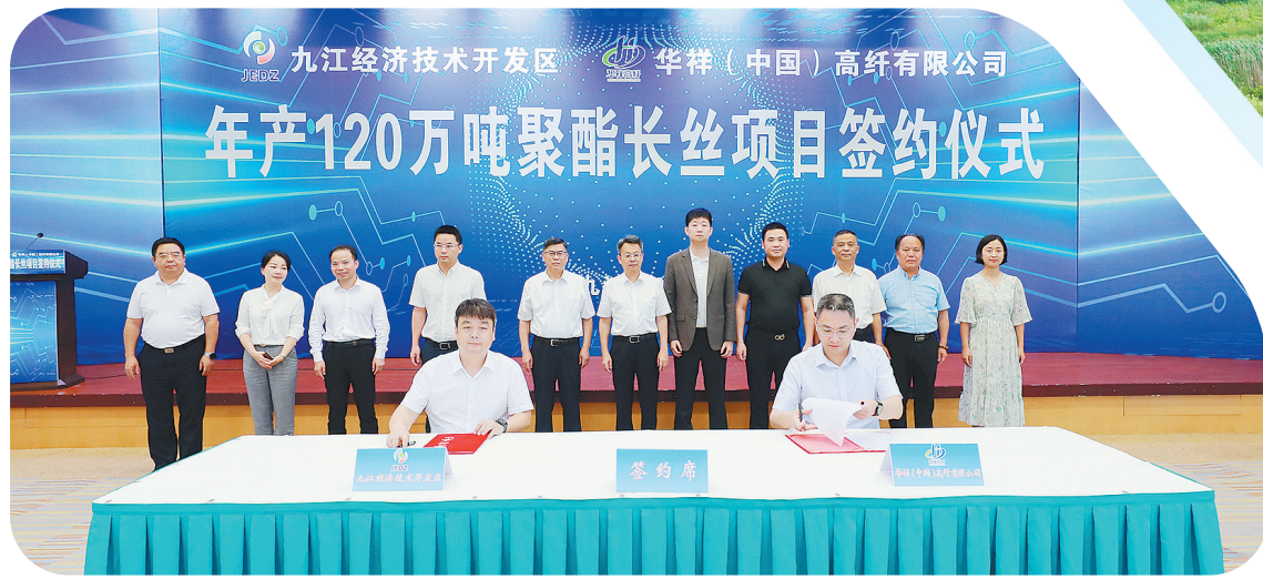
华祥120万吨聚酯长丝项目落户九江经开区签约仪式现场