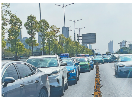
营运车辆排队长队等候进入西站停车场。