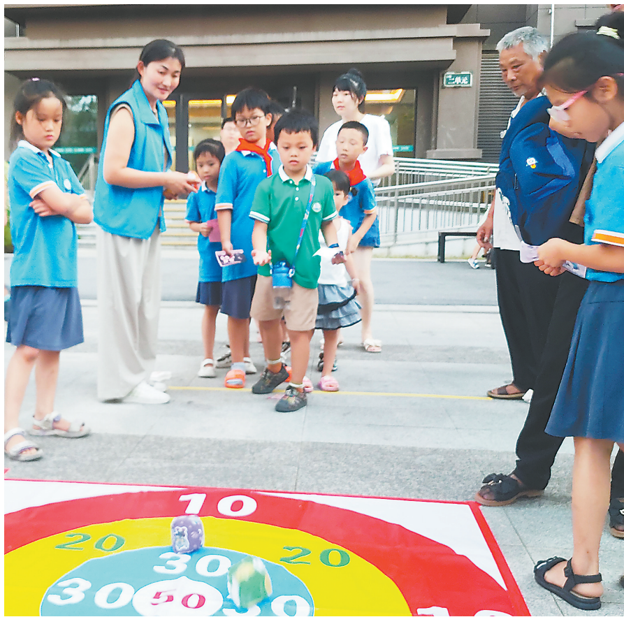
“童伴妈妈”在陪孩子们做游戏。

社区、余江区中童镇塘村、龙虎山风景名胜区内清镇沙湾村等地的“童心港湾”,在“童伴妈妈”和志愿者的组织下,携手爱心企业举办“月圆中秋 共话民俗”等主题活动,“留守儿童收获的快乐”。“我今天做了手工,吃了月饼,奶奶也跟我一起玩游戏。”9岁的小萱是塘塘村一名留守儿童,与妈妈电话视频时,分享了在“童心港湾”收获的快乐。 塘塘村的“童心港湾”占地面积1500平方米,建有老年食堂、儿童之家等功能室。这里有固定的活动场地、有稳定的志愿服务队伍、有活动经费来源。 “童心港湾”项目是由共青团中央发