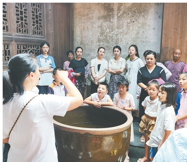
近日,一群孩子来到南昌市新建区汪山土库客家家风实践教学基地,了解客家家训文化。当地热心乡贤的耐心讲解,让孩子们在活动中感悟家风的力量,传承优良家风。

该县不仅注重提升社区硬件设施,还注重在服务质量上下足“绣花”功夫。通过定期培训、考核激励等措施,不断提升物业从业人员专业素养和服务水平,持续提升小区治理精细化水平,推动“红色物业”做到服务有温度、办事有进度。