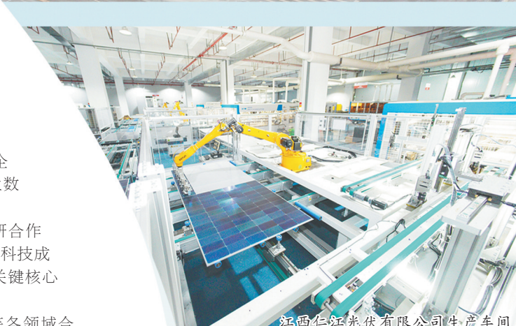
江西仁江光伏有限公司生产车间