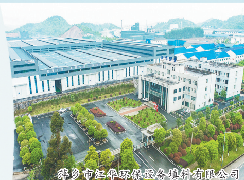
萍乡市红华环保设备材料有限公司