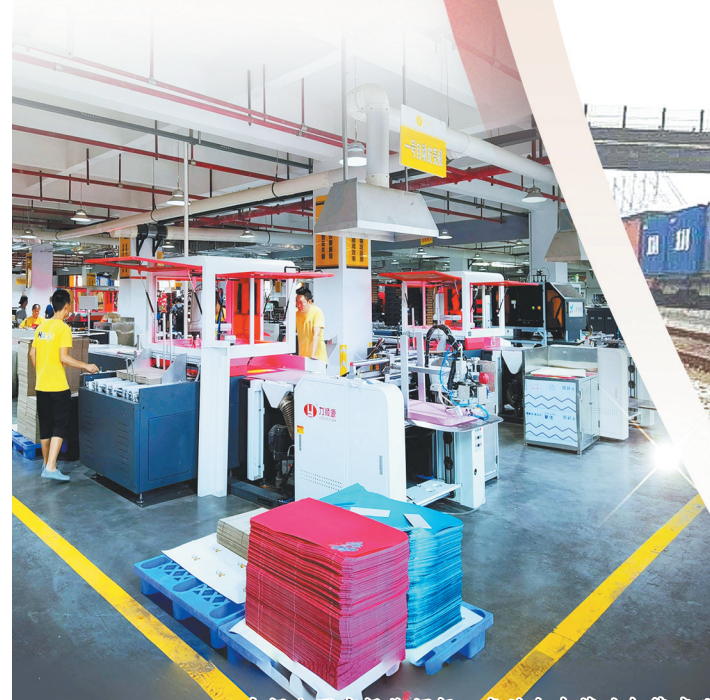
占据全国市场份额超四成的湘东茶叶包装产业