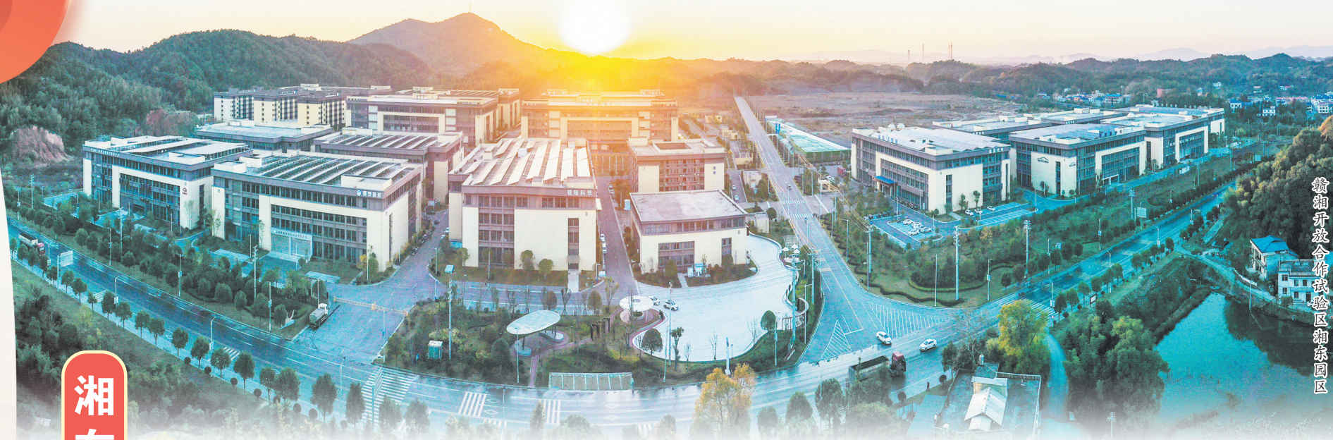
赣湘开放合作试验区湘东园区

工业兴则湘东兴，工业强则湘东强。一百多年前，赣湘两省第一条铁路——株萍铁路在湘东建成通车；七十年前，江西的第一炉钢铁在湘东诞生；五十年前，世界上第一块人造深冷硬瓷球在湘东生产……湘东人薪火相传、赓续奋斗血脉，拼搏进取的身影，永远镌刻在萍乡市湘东区的历史岁月里。