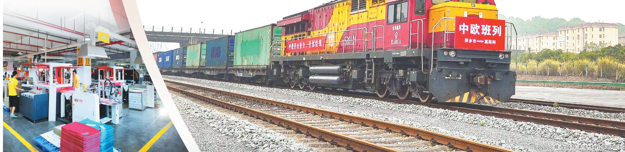
赣西国际港发车的中欧班列