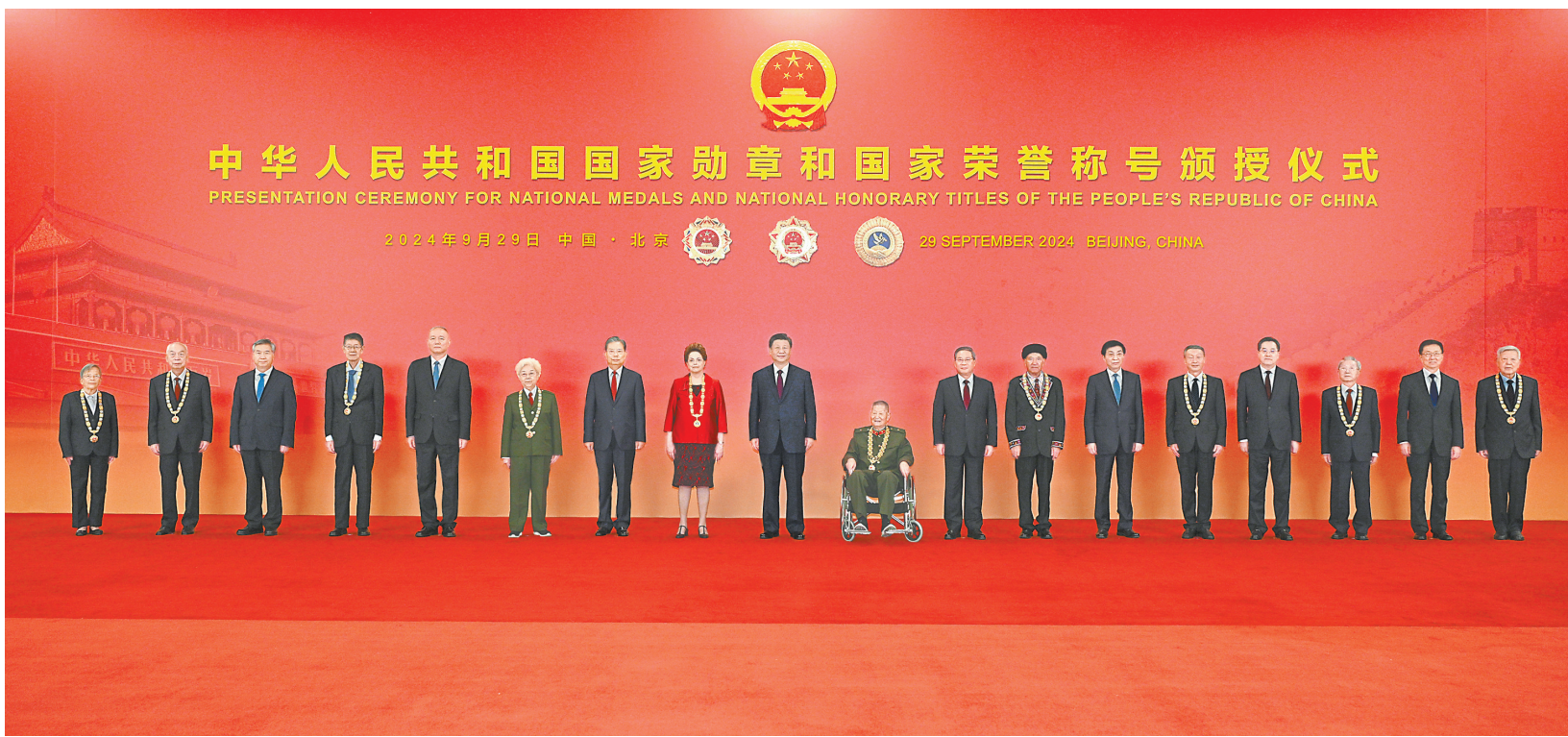
9月29日,中华人民共和国国家勋章和国家荣誉称号颁授仪式在北京人民大会堂金色大厅隆重举行。习近平等领导同志同国家勋章和国家荣誉称号获得者合影留念。

新华社北京9月29日电 中华人民共和国国家勋章和国家荣誉称号颁授仪式29日上午在北京人民大会堂金色大厅隆重举行。中共中央总书记、国家主席、中央军委主席习近平向国家勋章和国家荣誉称号获得者颁授勋章奖章并发表重要讲话。习近平强调,伟大时代