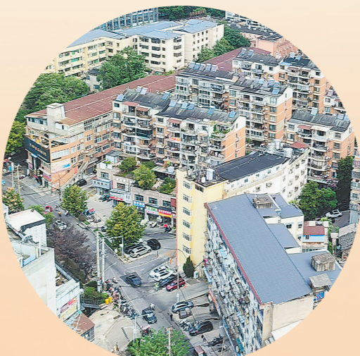
景德镇市珠山区解放路周边现状。本报全媒体记者 王景萍摄