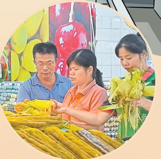
丰城市民在解放路商超购物。