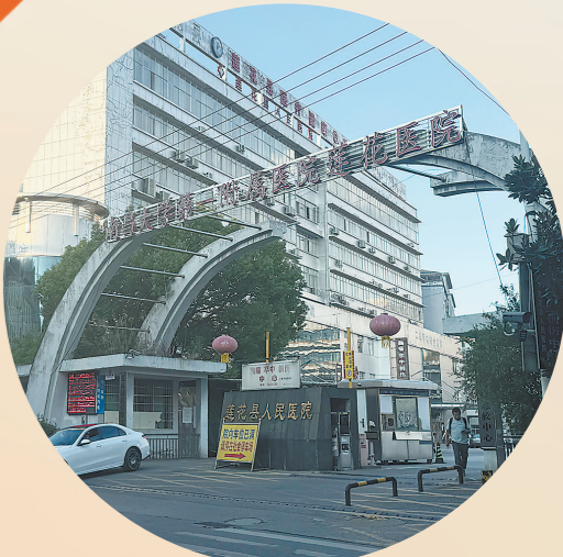
坐落在解放街上的莲花县人民医院。