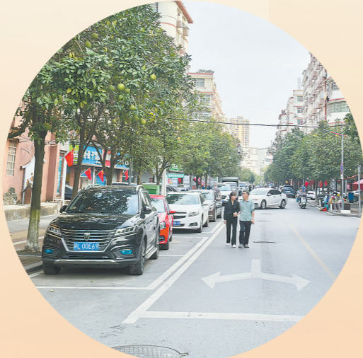
鹰潭市月湖区解放路一角。