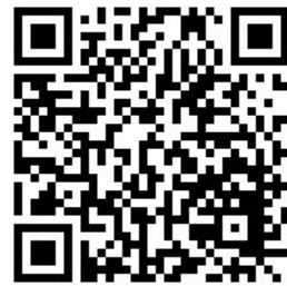
阅读《意见》全文 请扫描二维码

《意见》提出，要提升基层应急管理组织指挥能力，把党的领导贯彻到基层应急管理工作全过程各方面。理顺应急管理体制，建立应急指挥机制，健全责任落实机制。要提高基层安全风险防范能力，强化智能监测预警，做实隐患排查治理，依法开展监督检查，广泛开展科普宣传。要增强基层应急救援队伍实战能力，完善救援力量体系，鼓励支持社会应急力量发展，加强一体管理与实战训练，加强队伍规范化建设。要提升基层应急处置能力，加强预案编制和演练，加强值班值守和信息报告发布，开展先期处置，统筹做好灾后救助。要强化基层应急管理支撑保障能力，强化人才支持，保障资金投入，强化物资保障，加强科技赋能，推进标准化建设。要强化组织实施，明确细化落实应急管理各项工作任务，充分发挥群团组织作用，完善相关政策，形成工作合力。