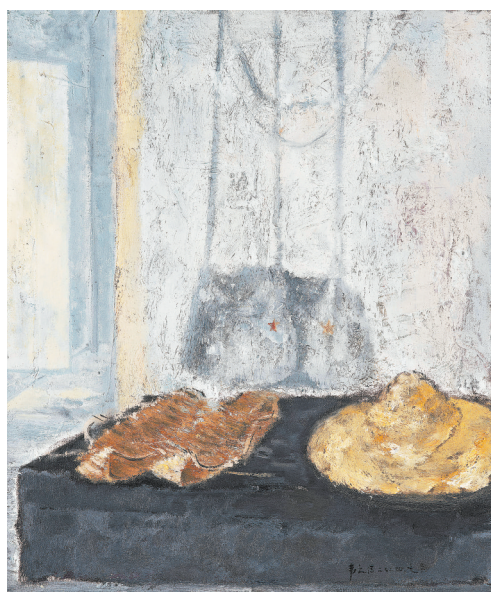
油画《红军遗物》(“大道薪火 文脉延绵——青原区庆祝中华人民共和国成立75周年暨全国知名画家青原采风作品展”) 韦之信绘

为庆祝中华人民共和国成立75周年而举办的艺术展,吉安市青原区的“大道薪火 文脉延绵——青原区庆祝中华人民共和国成立75周年暨全国知名画家青原采风作品展”,虽为一个区主办,却是一个策展水平、艺术水平都较高的展览。此展深度挖掘当地红古交辉的文化资源,前期特邀全国国画界、油画界26位名家前来青原区实地采风调研,创作出一批融思想性、艺术性于一体的优秀作品。这种将地方特色文化通过高水平艺术展览形式集中呈现的模式,或可为其他地方文旅融合创新带来有益的启迪。