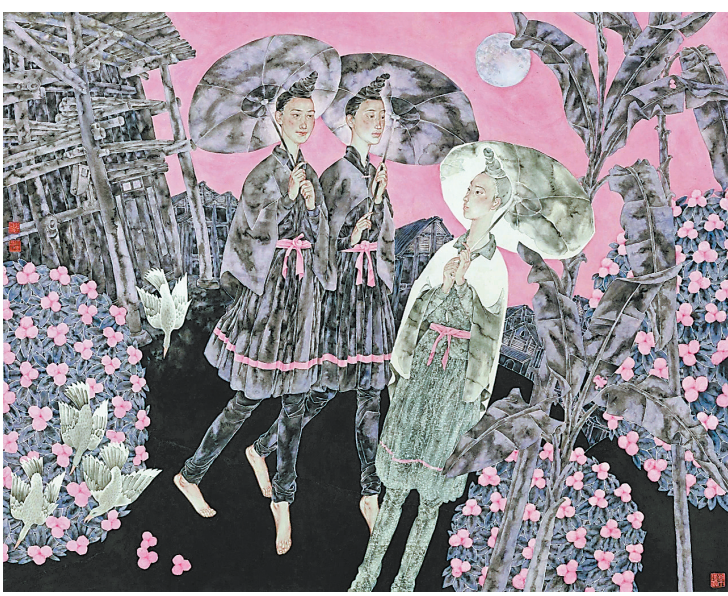
工笔《苗寨小雨润如酥》(“大美长江 豫章之约——中国工笔画名家作品展”) 陈孟昕绘