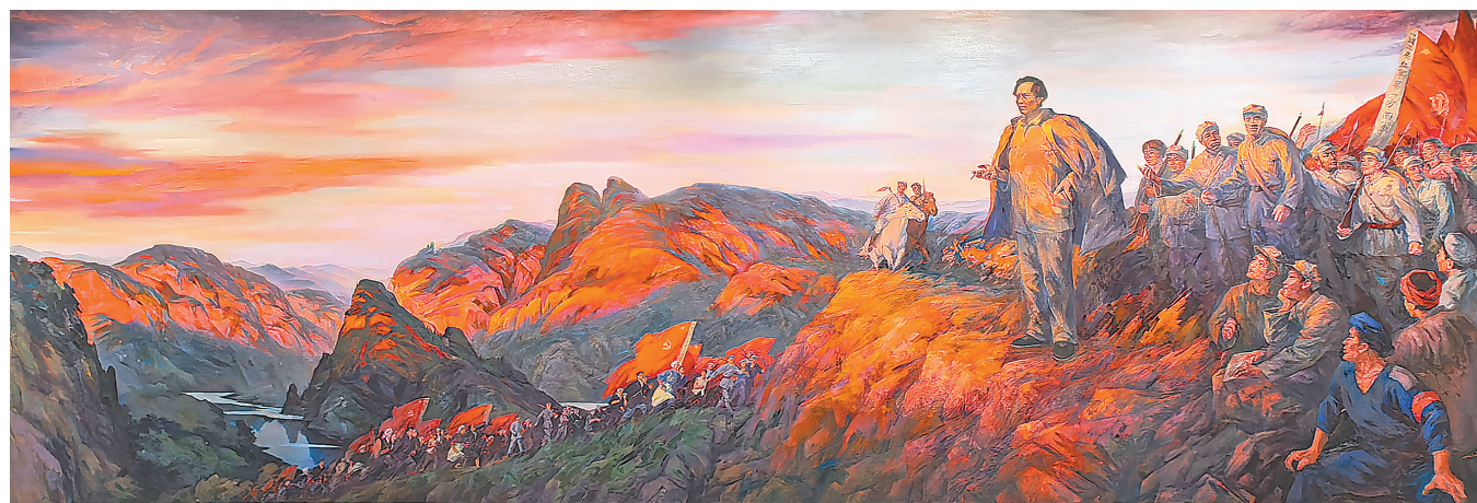
油画《赣鄱一片红》(“风展红旗——中央美术学院支持赣南原中央苏区红色主题创作作品展”) 孙 韬、叶 南、杨 骁绘