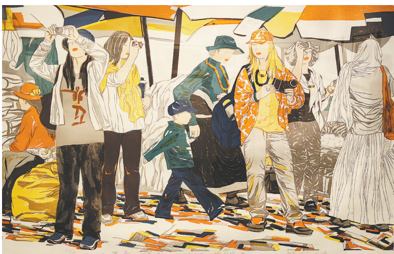
综合版《甘南日记》(“叙事中国——全国叙事性、主题性版画作品邀请展”) 班 群作