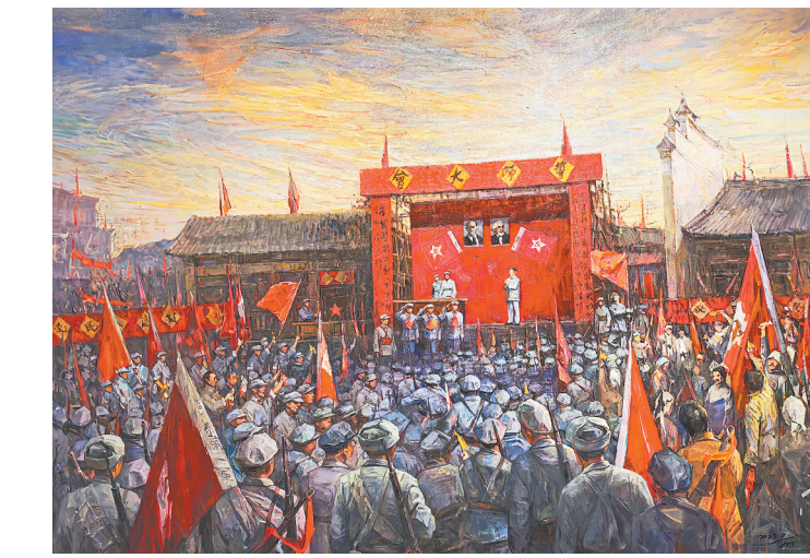
油画《中央苏区第一次反“围剿”战争》(“风展红旗——中央美术学院支持赣南原中央苏区红色主题创作作品展”) 张峻明绘