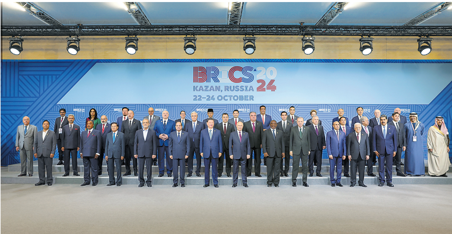
当地时间10月24日上午,国家主席习近平在喀山会展中心出席“金砖+”领导人对话会并发表题为《汇聚“全球南方”磅礴力量 共同推动构建人类命运共同体》的重要讲话。这是出席对话会的金砖国家及嘉宾国领导人或代表、国际组织负责人集体合影。