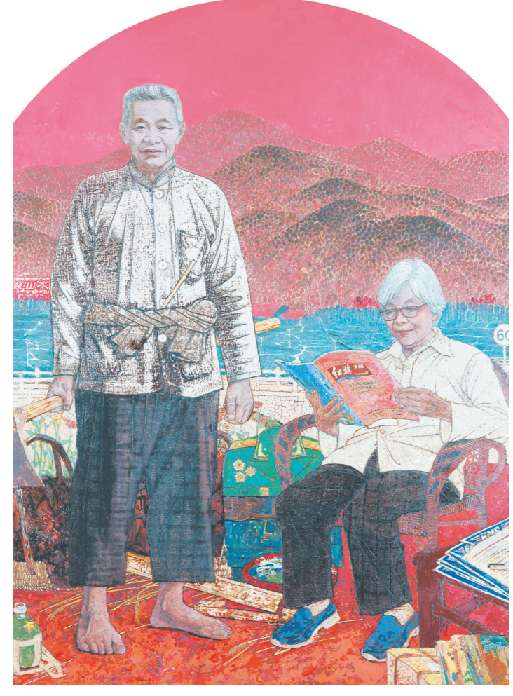
刘双喜《老将军和老阿姨》170cm×220cm