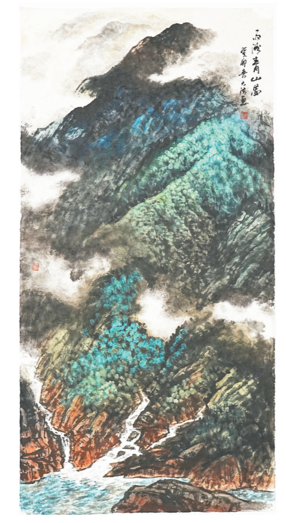
石大法《雨浴青山图》140cm×70cm

家、文学艺术家和普通劳动者造像；我画水彩和彩墨画，大都为祖国雄浑、壮美与如娇江山神韵古诗，抒发我热爱祖国大好河山的由衷情怀。从2016年7月广东美术馆为我举办《历史的脚印——钱海源艺术展》，到2023年11月江西美术馆为我举办《立体的人生——钱海源艺术展》，到2023年11月江西美术馆为艺68周年回顾展，到今年7月23日湖南美术馆又为我举办的《人相随溯——钱海源湖南40年回顾展》，众多的观展点赞是对我坚持艺术为民的最高褒奖。