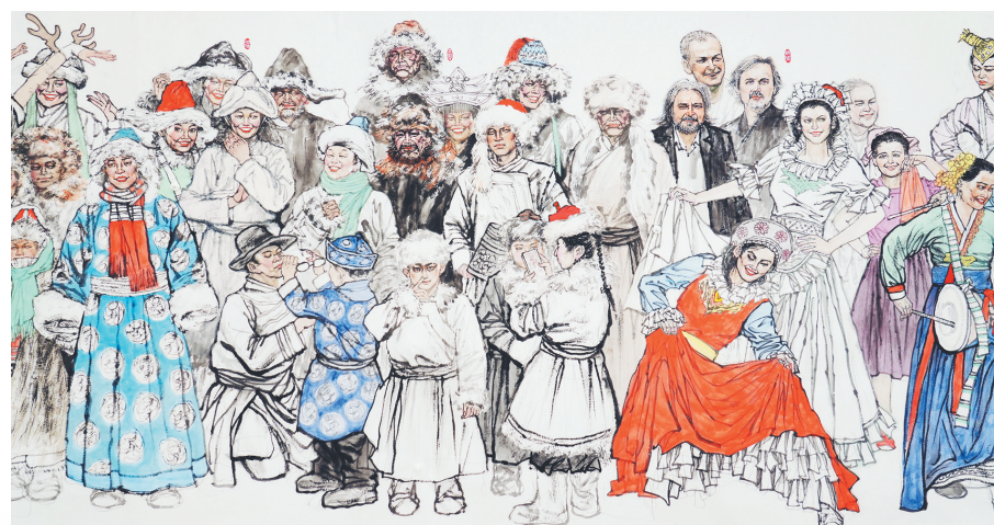
百米画卷《中华民族大团结》局部