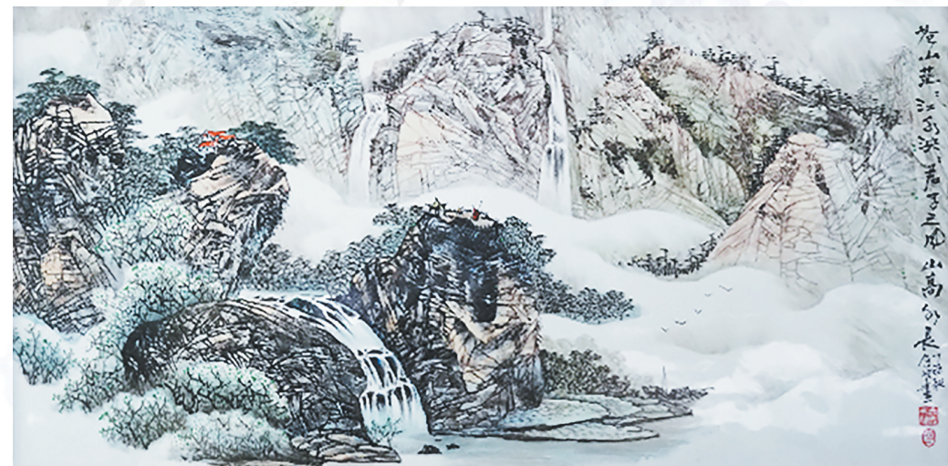
瓷板画《苍山茫茫 江水泱泱 君子之风 山高水长》