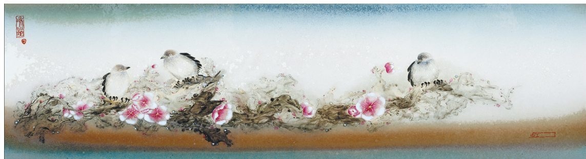
色釉装饰《林中鸟听佛声》瓷板画