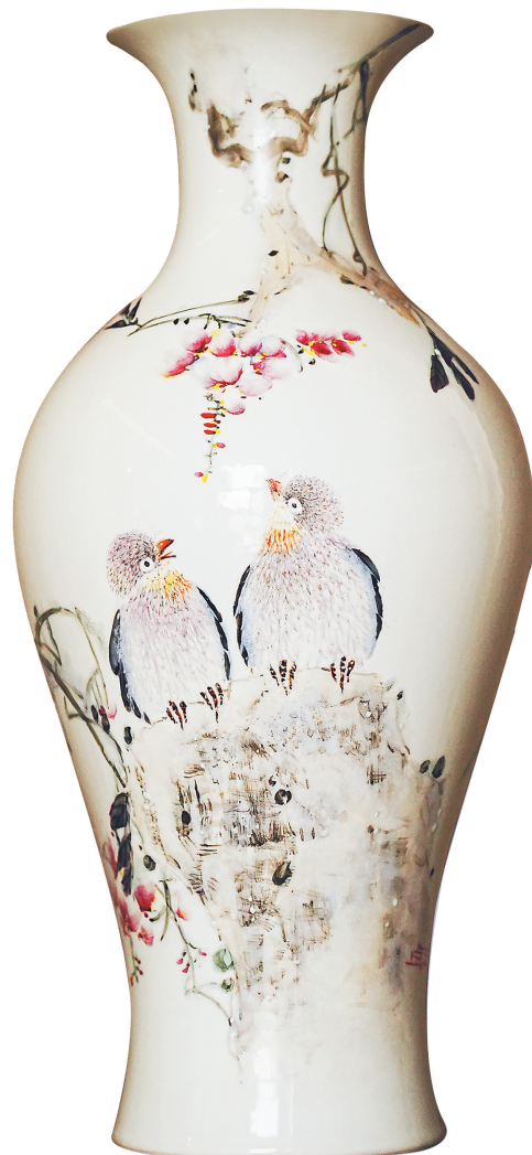
釉上彩《紫云飘香》瓶 (被江西日报社艺术馆收藏)