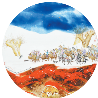
高温窑变粉墨彩《丝路风情》瓷板画 规格:80cm×80cm