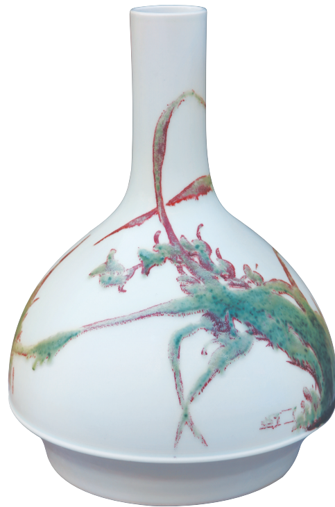
青花釉里红《幽香》瓶