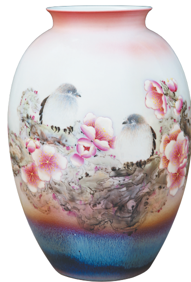
色釉装饰《窃窃私语》瓶