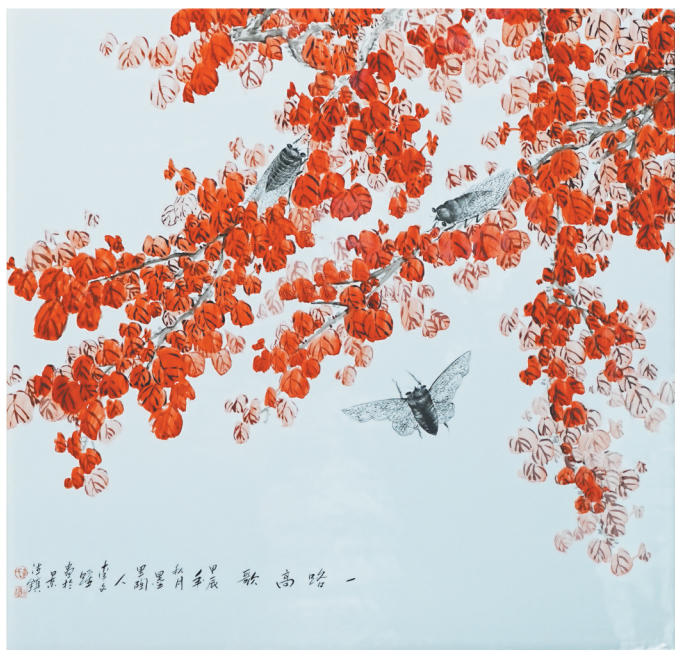
墨彩《一路高歌》瓷板画(被江西日报社艺术馆收藏) 规格:60cm×60cm