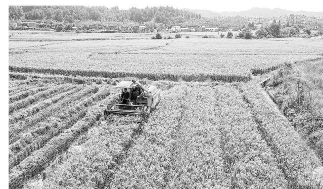
10月26日，广昌县尖峰乡沙背村农机手驾驶收割机在田间收割晚稻。时下，正值晚稻成熟时节，当地农民抢抓时机收割，确保秋粮颗粒归仓。