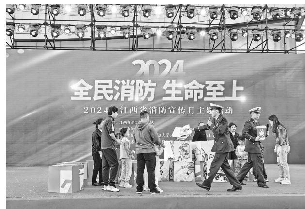
11月2日，2024年江西省消防宣传月主题活动在南昌市红谷滩区某大型商业综合体举行。现场通过文艺演出、游戏互动、专业咨询等形式，提升群众消防意识。

此次职业技能竞赛聚焦漆器创作领域，设置漆器彩绘雕填装饰美工与漆器镶嵌装饰美工两个竞赛项目，吸引了来自全省各地的80余名职业青年同台竞技。在为期两天的激烈角逐中，参赛选手以漆器为核心元素，凭借巧妙构思与精湛技艺，将漆器的质感、色彩及形态融为一体，充分展现了参赛选手对漆器艺术的独到见解和创新精神。职业技能竞赛开展期间，主办方配套举办了漆器作品展、漆器艺术讲座等交流活动。