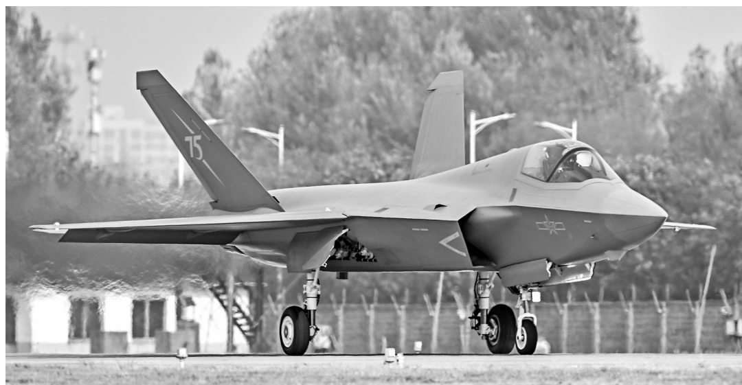
▲歼-35A飞机在滑行（资料照片）。