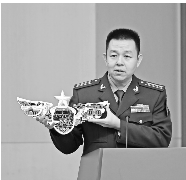
▲11月5日，中国空军新闻发言人谢鹏在新闻发布会上发布12个空军红色地标和相关产品。

据悉，这届航展上空军设立的展台数量和面积将创新高。除招飞展台外，空军首次围绕航管、地面院校以及装备修理技术等领域分别设立独立展台，向社会各界提供了解中国空军的窗口。