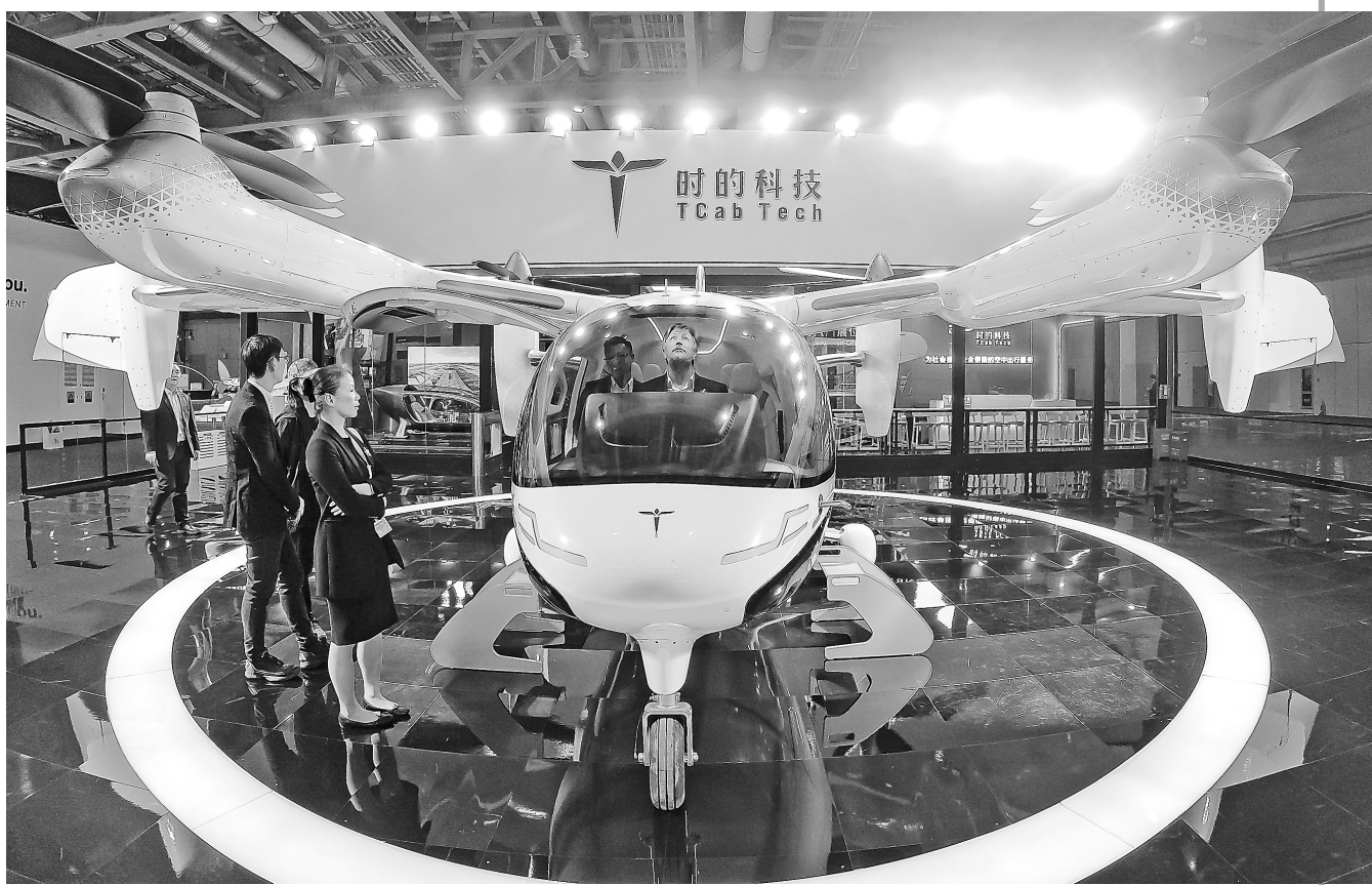
▲11月5日在第七届进博会国家展上拍摄的伊朗馆。