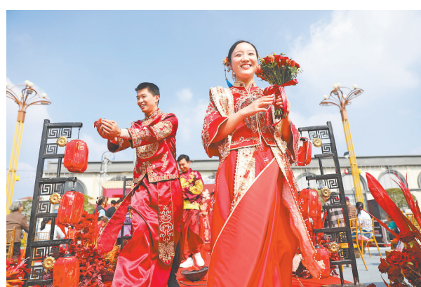
11月2日，万安县在恒安公园美食坊举办2024年集体婚礼，11对新人在浓浓的中式浪漫中完成婚礼。

今年以来，抚州市“法律明白人”开展法治宣传等各类法治实践16万次，广大群众的法治意识明显提升，办事依法、遇事找法、解决问题用法、化解矛盾靠法的氛围日益浓厚。(陈玲 万剑)