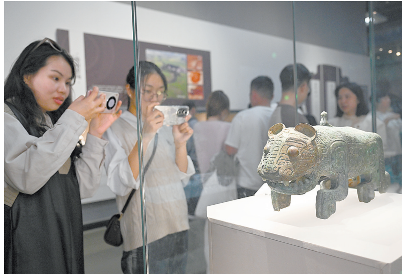
11月3日,江西省博物馆展厅内人潮涌动,游客在文物展台前驻足拍照。随着经济发展和收入提高,人们对精神文化生活的需求日益增长,博物馆已成为市民在休息日感受文化魅力的热门去处。

围绕数字经济核心领域,聚焦人工智能、高端制造等重点赛道,我省大力引进服务业龙头企业落户,带动服务业企业效益持续改善。前三季度,全省规上服务业企业利润总额同比增长2.7%,较上半年加快3.3个百分点,32个行业大类中,27个行业实现盈利;全省规上服务业营收排名前100的企业合计实现营收1307.4亿元,同比增长15.2%。民营企业在一系列利好政策拉动下,经营状况不断向好。前三季度,全省规