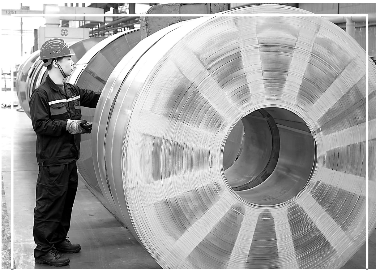
10月30日，在位于贵溪经开区的江西云泰铜业有限公司生产车间内，工人正在封装加工好的黄铜带。该公司产品广泛应用于电子连接器、高端电气等领域，前三季度实现产值56.95亿元，预计全年可加工铜带材9.36万吨，实现产值75.31亿元。