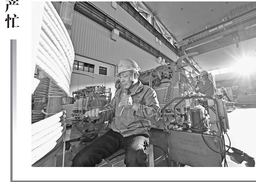
近日，在位于南昌经开区的江西变压器科技股份有限公司厂房内，各条生产线满负荷运转，工人们正在加紧组装、检测变压器。近年来，该企业促进产品向高端化、智能化转型，产品远销海外。据统计，该企业前三季度产值达7.5亿元。