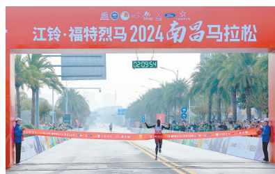
来自肯尼亚的KURGAT夺得马拉松男子组第一名

登场皆英雄。一场马拉松的成功举办,背后是主办单位和赛事组委会无数人夜以继日的付出与坚守,一个