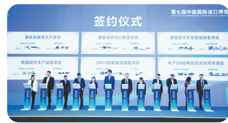
11月7日,第七届进博会江西招商引资推介会签约仪式。

稳步开拓外经市场。深度融入共建“一带一路”,加强与共建国家经贸往来,推动优势产能“走出去”,支持企业积极拓展境外“投建营”模式,新中标安哥拉医院和公寓建设项目、乌干达太阳能发电项目和公路建设项目等。举办援外培训24期,为45个发展中国家和地区培训官员和技术人员586人,扩大了朋友圈,助力企业更好“走出去”。