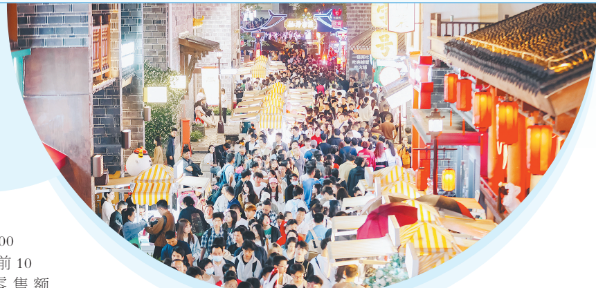
南昌万寿宫历史文化街区成为消费新地标。

加快现代商贸流通体系建设。推动南昌市成功入选首批全国现代商贸流通体系试点城市,推进一刻钟便民生活圈建设,深入实施县域商业建设行动,持续开展第三批县域物流配送体系建设试点,新增第三批中华老字号13个,认定第六批江西老字号15个,新增限额以上商贸经营主体4300余家,消费场景、主体不断优化提升。