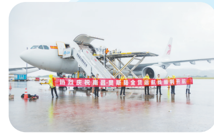
7月2日,国内首条直飞挪威(南昌—奥斯陆)全货运航线顺利首航。

推进高水平对外开放,是构建新发展格局的应有之义,也是促进高质量发展的必然要求。省商务厅不断创新扩大开放的新方式新举措,持续推动外贸转型升级,进一步壮大外贸发展新动能,加快打造内陆地区改革开放高地,以高水平对外开放助推高质量发展。