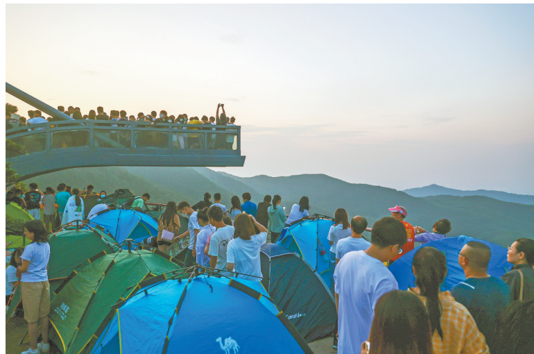
2022年7月31日,游客在南昌市湾里管理局“高路入云端”景区观看日出。