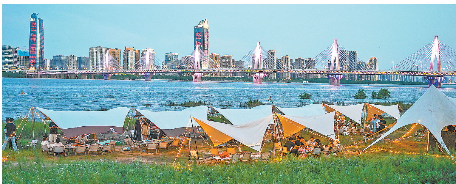
7月6日,夜幕降临,在南昌朝阳大桥附近,露营的市民吹江风、尝美食,看都市霓虹,自在又惬意。