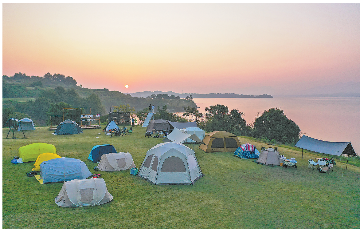
11月3日,九江市庐山西海景区的森海帐篷营地,红日初升,风景如画。