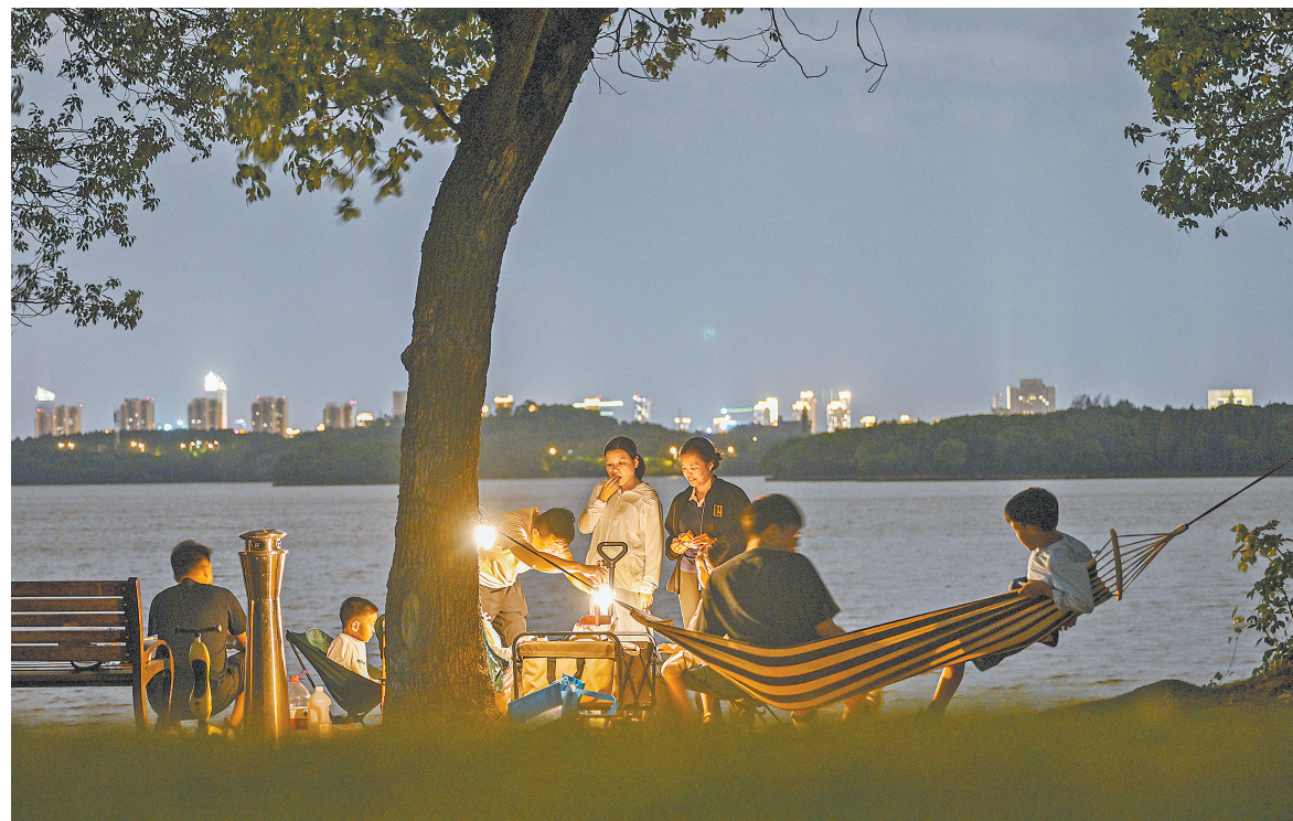
9月22日,南昌市前湖公园,游客在湖畔露营,享受亲子时光。

寻觅一处静谧之所,或山谷之间,或水泽之畔,或星空之下;搭建一顶帐篷,或品尝美食,或欣赏美景,或放松身心,已成为不少人休闲度假的新选择。