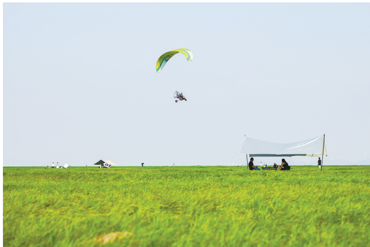
9月25日,游客在庐山市蓼南乡露营。