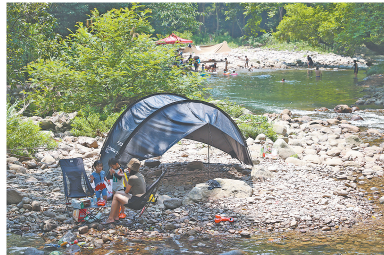
2022年7月28日,在靖安县一条小溪边,游客支起帐篷,戏水纳凉。