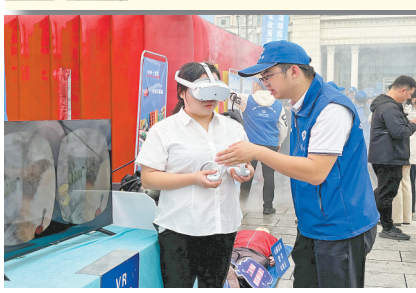
群众在工伤预防区进行VR事故模拟体验。