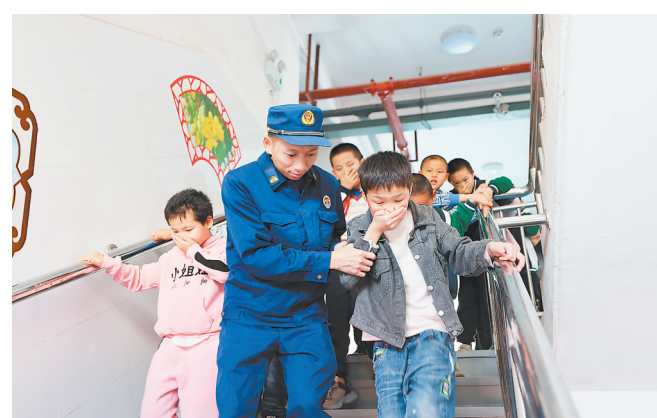
近日，永丰县特殊教育学校开展了一场应急演练。消防救援人员用不同方式，细心地向学生讲解消防逃生知识。演练中，师生们在消防救援人员的指挥下，有序、迅速、安全地撤离。