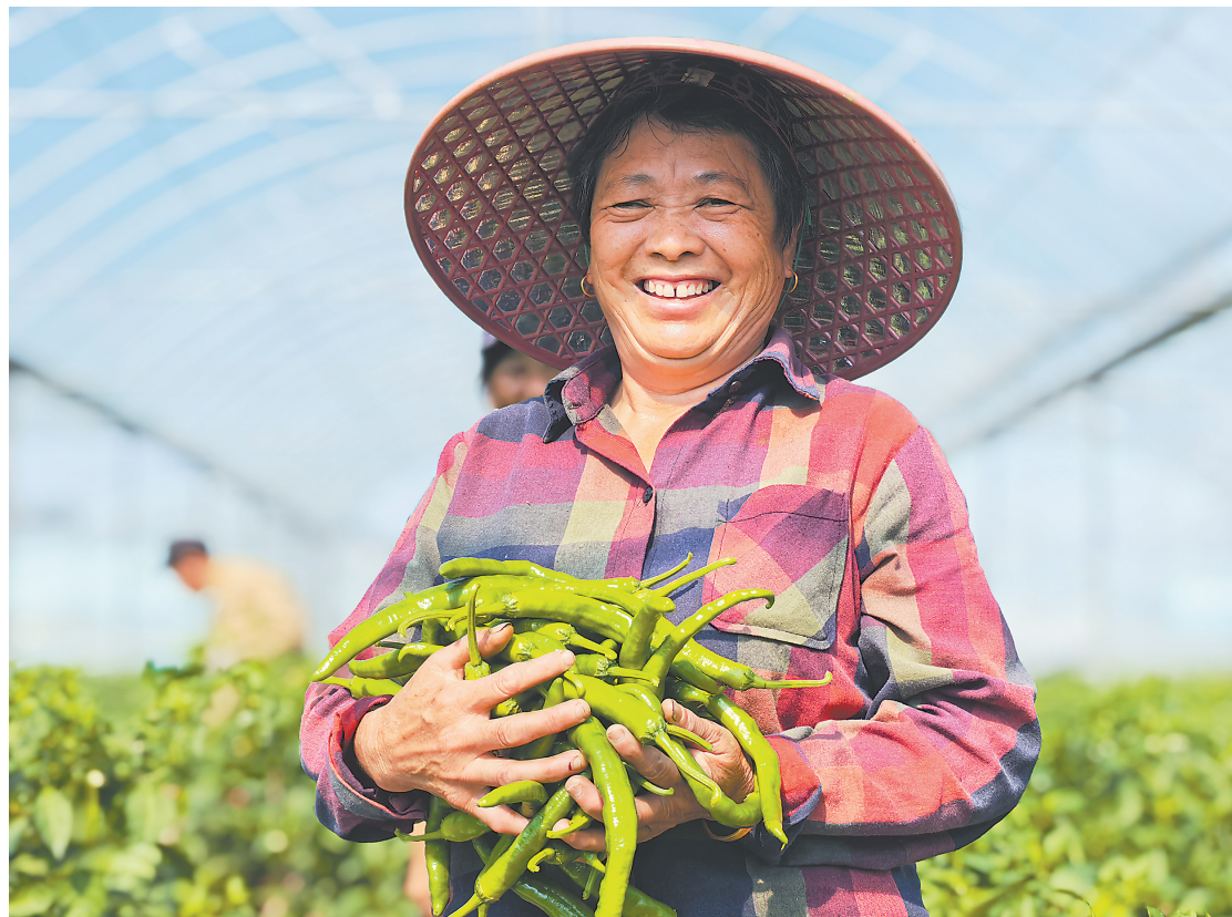
村民在家门口的蔬菜基地务工。

村里人气高涨，村民们有的卖起了土特产，有的摆上了小吃摊，还有的开办民宿。吃上“旅游饭”的七峰村，现在不