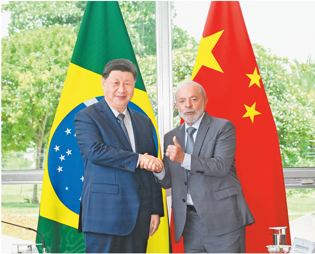
当地时间11月20日上午,国家主席习近平在巴西利亚总统官邸黎明宫同巴西总统卢拉举行会谈。

新华社巴西利亚11月20日电 (记者倪四义、陈威华)当地时间11月20日上午,国家主席习近平在巴西利亚总统官邸黎明宫同巴西总统卢拉举行会谈。两国元首宣布,将中巴关系定位为携手构建更公正世界和更可持续星球的中巴命运共同体。 初夏时节的巴西利亚,天朗气清。黎明宫内,绿草如茵,450名威武礼兵整齐列队。在120名龙骑兵护卫下,习近平乘专机抵达黎明宫前广场。卢拉总统和夫人罗桑德拉热情迎接习近平,并为习近平举行隆重盛大欢迎仪式。 军乐团奏中巴两国国歌。两国元首一同观看仪仗队列队。中巴儿童挥舞两国国旗热烈欢迎习近平。巴西艺术家用中文演唱《我的祖国》。 两国元首分别同对方陪同人员握手致意。欢迎仪式后,两国元首举行会谈。 习近平指出,很高兴在中巴建交50周年这个具有重要历史意义的年份访问巴西。刚才卢拉总统为我举行最高礼遇的隆重欢迎仪式,充分体现了对中巴关系的高度重视以及对中国人民的深情厚谊,令我深受感动。中国和巴西是东西半球两大发展中国家。回首过去50年,中巴关系跨越山海,探索出发展中大国相互尊重、互利友好、合作共赢的正确相处之道。巴西是首个同中国建立战略伙伴关系的国家、首个同中国建立全面战略合作关系的拉美国家。近年来,在我和卢拉总统战略引领下,两国日益成为命运与共的可靠朋友、共促和平的积极力量,中