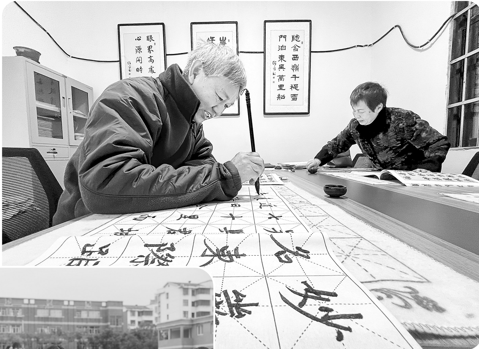
▲11月20日,南昌市红谷滩区沙井街道汇和家园小区书法室,老年人正在静心练习书法。近年来,红谷滩区聚焦老年人多元化养老服务需求,加快推进基础设施建设,提升服务管理,让老年人老有所养、老有所学、老有所乐。