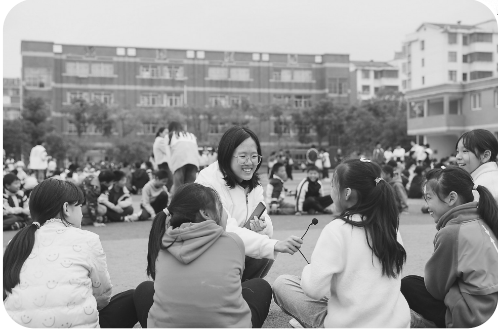
▲11月19日,井冈山大学35名师范类专业大学生来到万安县五丰中心小学,通过户外游戏,为学生们带来了一场开心快乐的心理健康辅导课程。