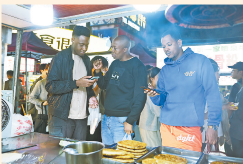
外国友人在夜市里品尝美食。