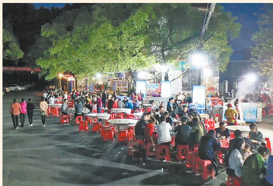
2020年，改造前的分宜电厂螺蛳特色景区。（资料图）