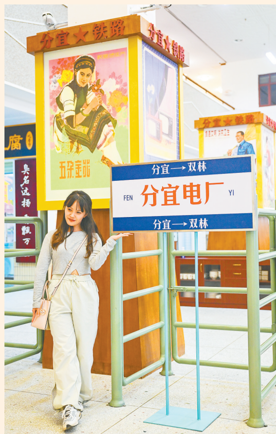
富有年代感的场景，吸引游客拍照留念。