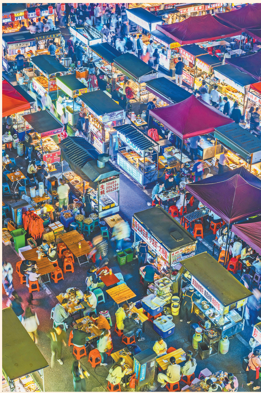
11月16日，南昌经开区紫荆夜市人头攒动，浓浓的城市烟火气扑面而来。