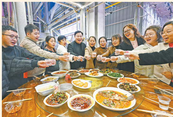
11月26日，游客在老字号夜宵店享受螺蛳、冬瓜饼等特色美食。