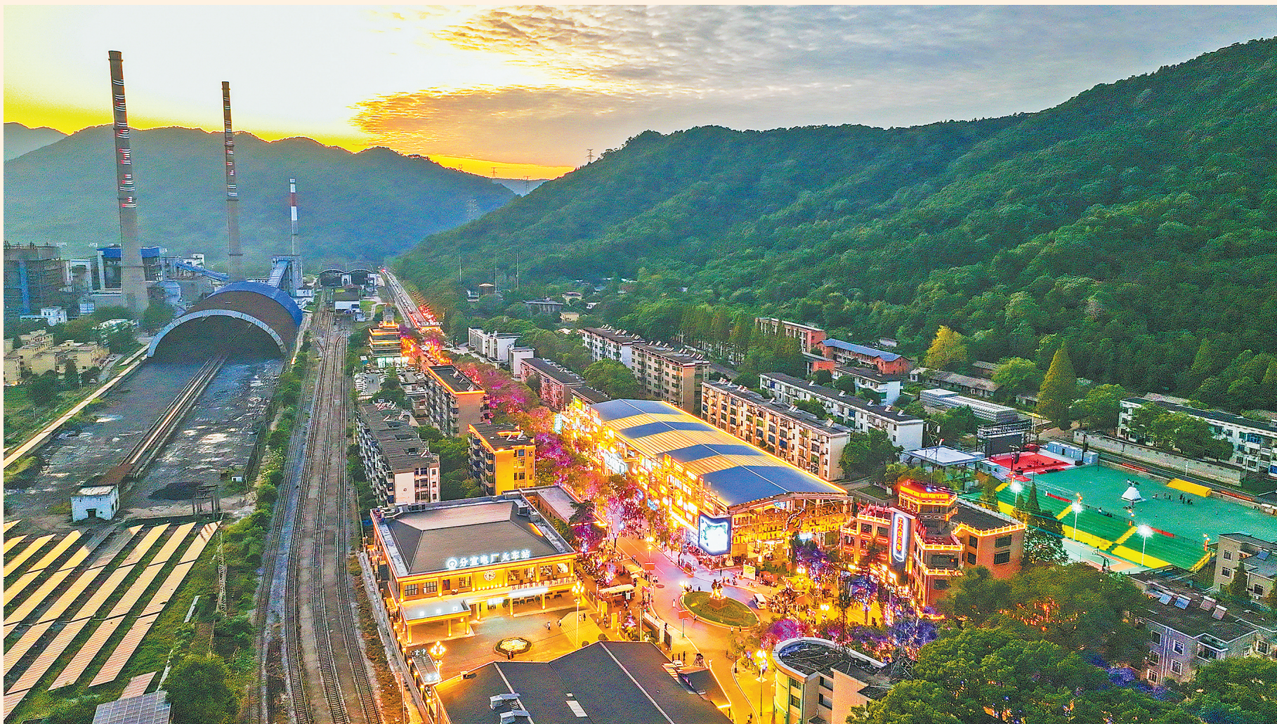
傍晚时分，分宜电厂螺蛳特色景区在夕阳的映照下，烟火气十足。

曾经的零星夜市摊，如今变成夜间经济消费聚集区。悄然走红的分宜电厂螺蛳特色景区，正以其独特的方式，为游客们提供更美好的夜间体验。