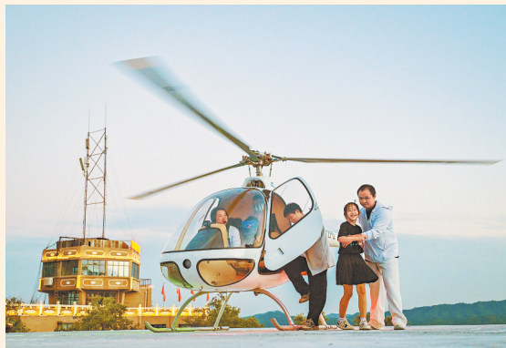
游客在景区体验直升机项目。