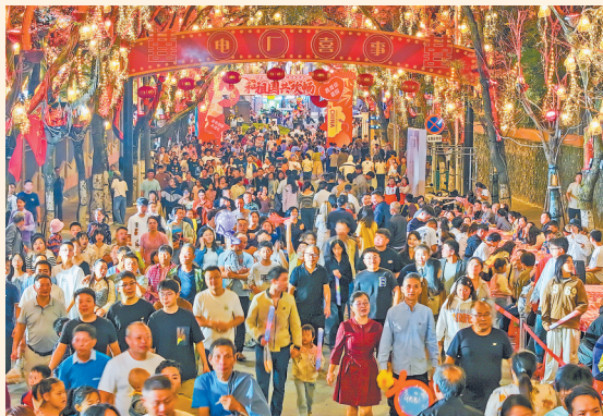
大批游客涌入景区，现场热闹非凡。