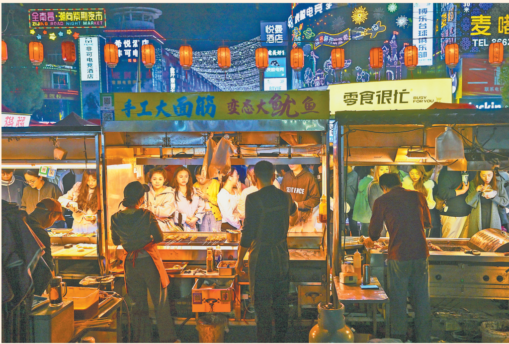
市民们在排队购买美食。