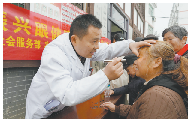
12月5日，农工党鹰潭市委组织志愿者来到贵溪市文坊镇花桥水库移民新村，为村民提供专业的眼科诊疗服务，免费发放老花眼镜，打通服务群众“最后一公里”。

该局通过举办全县打击欺诈骗保暨业务培训，进一步规范定点医院服务行为；对定点零售药店开展门诊统筹专项检查，精准打击违法行为；开展重点线索核查，对部分住院患者高频住院情况开展全面核查，并建立疑点数据台账，存档备查。“我们将持续保持高压态势，压实监管责任，完善监管制度，重拳打击医疗保障领域欺诈骗保违法违规行为，筑牢医保基金监管‘铜墙铁壁’，全力守护好人民群众的看病钱、救命钱。”该分局党组成员、副局长罗振华表示。