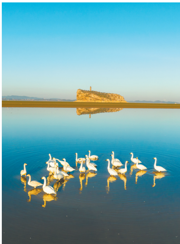
连日来，成群越冬候鸟在湖口县鄱阳湖鞋山水域栖息觅食。目前，鄱阳湖已进入候鸟越冬高峰期。