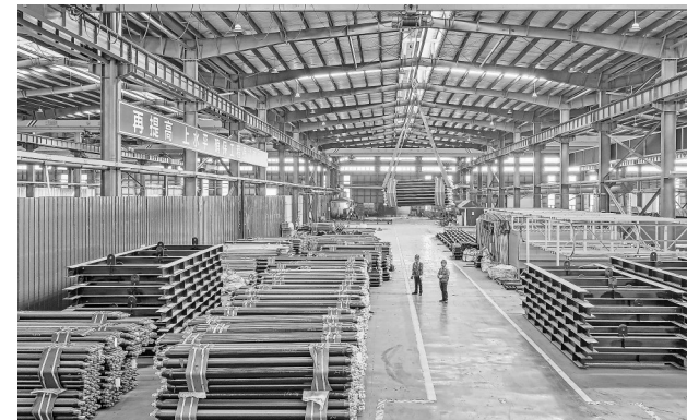
11月27日，位于萍乡市湘东区的江西森阔深海装备科技有限公司生产车间，工人正在吊运半成品网箱。该公司主要生产智能抗风浪海洋牧场深海网箱，把海水养殖空间从近海拓展到深海，可有效缓解近海养殖压力。