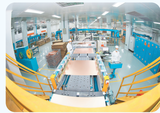
江西省智能制造标杆企业——江西生益科技有限公司

巨石集团九江有限公司玻纤新材料智能制造基地自动拉丝机、机械手臂等自动化设备高速运转；TCL空调器(九江)有限公司智能仓储,实现了产品自动进出库,有效提升了工作效率;江西科翔电子科技有限公司数据分析中心,一块巨大的显示屏上,环境指标、工况分析、能源效率等生产数据一目了然,实现了生产线的工艺、质量、能耗、效率等指标全面监控和数据采集填报分析一体化……当下,制造业数字化转型正为九江经济技术开发区新一轮高质量发展注入强劲动能。