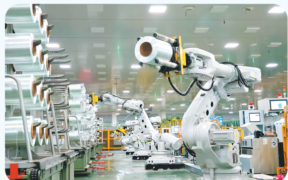
国家智能制造优秀场景榜单企业——巨石集团九江有限公司