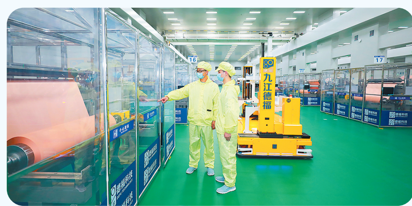
国家工业互联网试点示范企业——九江德福科技股份有限公司

导10家产业链骨干企业拟投入超8.2亿元专项资金,推动PCB产业链80%的企业改造提升至L6级以上,逐步实现电子信息主导产业链式转型;聚焦服务体系、技术场景、数字产业等精准发力,依托省级石化产业园,打造“5G+工业互联网平台”,推动园区安全应急环保的全维度、全指标、全业务覆盖。