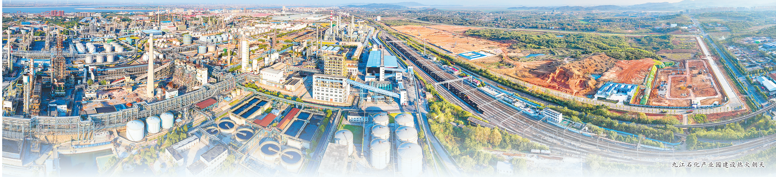
九江石化产业园建设热火朝天