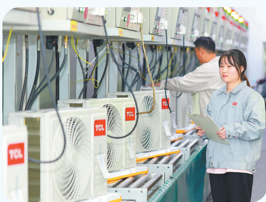
国家级“两化”融合管理体系贯标AA企业——TCL空调器(九江)有限公司