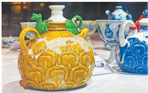
明宣德黄釉莲瓣纹四壶修复件。