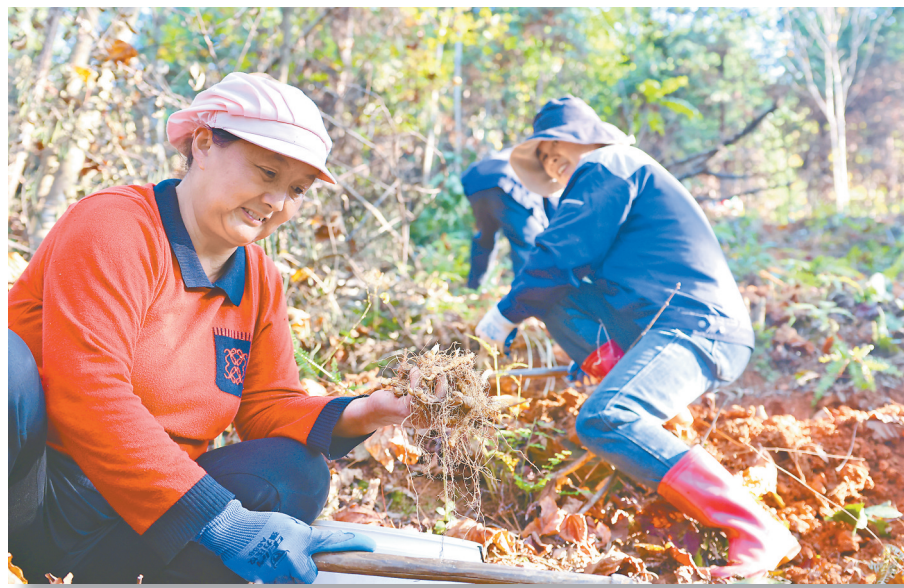
当地村民在冬季抚育黄精。