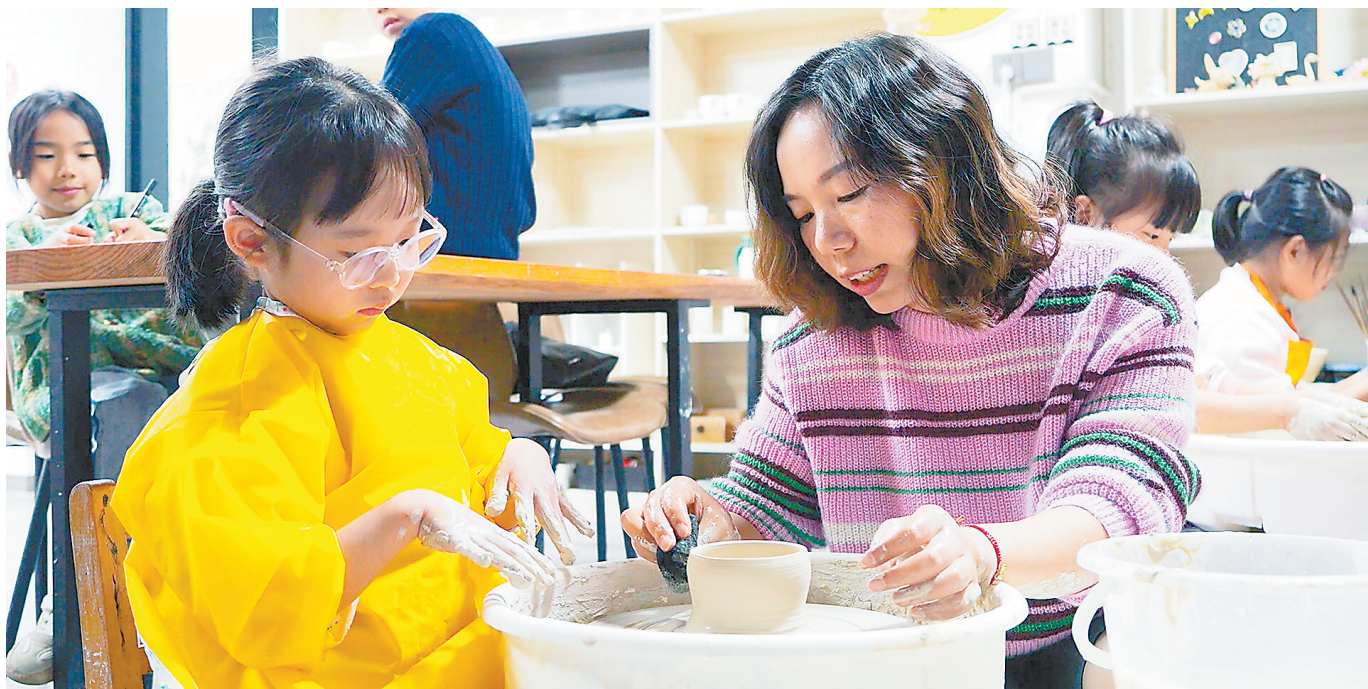
602所社区的志愿者正在教孩子拉坯。

珠山区是景德镇中心城区,老旧小区多,人口密度大。近年来,该区坚持党建引领,协同治理,充分搭建居民议事平台,完善群众协商机制,并选聘专职网格员构建社区服务体系,畅通居民诉求渠道。同时,该区聚焦志愿服务,通过多方合作共建,积极拓宽服务领域,激活基层治理的“神经末梢”,不断提升群众的获得感和幸福感。