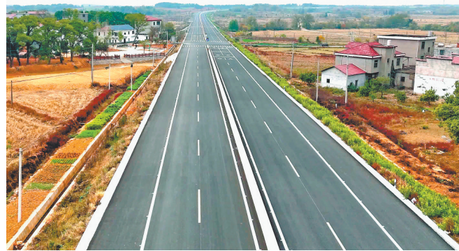
12月20日,G533樟树城区至牛石背段一级公路改建工程正式完工通车。该项目总投资10.25亿元,由樟树市政府投资,宜春市公路事业发展中心及其下属的樟树分公司建设,路线全长33.2公里。该公路通车后,刘公庙、吴城等边远乡镇居民的出行条件得到改善,为当地乡村振兴、产业发展、村民致富奠定了良好的交通基础。

城市更新,一头连着城市发展,一头连着民生福祉。近年来,瑞昌市共投入13.44亿元,对41个老旧小区进行改造,总建筑面积293.51万平方米,惠及3.36万户居民;打造完整社区5个,惠及8576户;改造菜市场8个,建设小花园、小游园和小憩园6个,让城市既有“面子”,更有“里子”,让群众生活更舒心、更安心、更幸福。