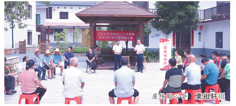
屋场贴心会

从2008年起，上栗县选派1284名干部作为“群众贴心人”，分别联系全县1284个自然村，他们利用乡情、亲情资源，收集社情民意、调处矛盾纠纷，助力基层维护社会和谐稳定。16年来，“群众贴心人”活动不断探索、丰富、完善，形成了工作长效机制，在健全共建共治共享的社会治理制度、提升基层社会治理效能方面发挥了重要作用。近日，我省新型重点建设智库——新时代党建创新与江西实践研究所的专家学者，深入上栗县就此开展调研。本期刊出部分调研文章，以飨读者。 ——编者