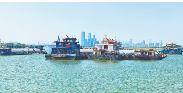
原本混乱的江边码头变得干净整洁。