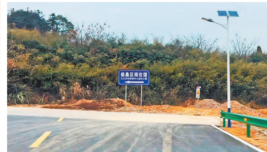
通往柴桑区殡仪馆的道路已修好。

10月份完工并通车，而且还有两条通往柴桑区殡仪馆的道路正在规划。 在该馆服务中心前台，工作人员正在接待前来咨询的市民，馆内对外宣传栏公示了殡葬服务项目的各种收费标准和投诉举报电话等信息。