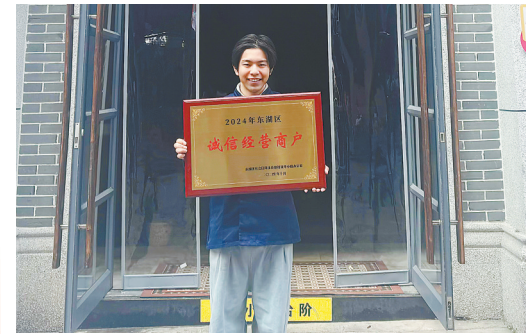
嘉宾楼获评街区首批“诚信经营商户”。