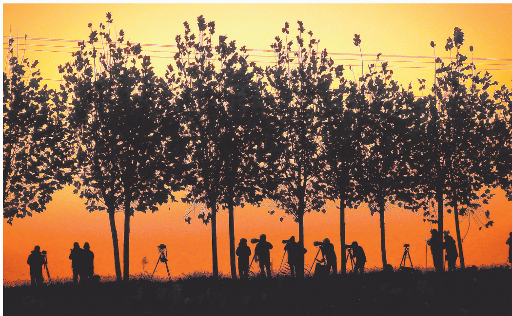
12月17日,天还未亮,许多爱鸟人士和摄影爱好者已经架好机位,准备观鸟拍摄。