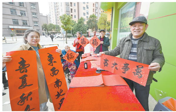
1月23日,南昌市青云谱区三家店街道三店西社区,书法爱好者挥毫泼墨,为居民写春联、赠“福”字。