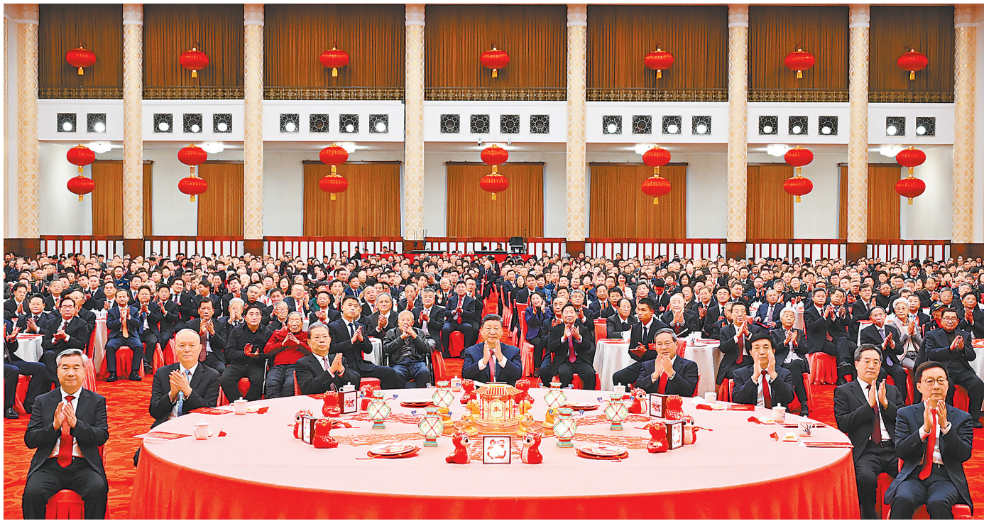
1月27日,中共中央、国务院在北京人民大会堂举行2025年春节团拜会。中共中央总书记、国家主席、中央军委主席习近平发表讲话。