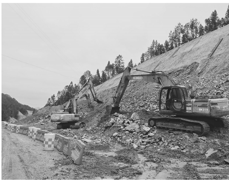
2月21日，省重点项目——G206昌吉白沙坪至田西村南岭段公路改建工程项目现场，工人正在加紧施工。

在项目建设中，柴桑区坚定实施绿色循环经济战略，通过成立招商专班、建设循环经济产业园、推动九江循环经济集团成立等一系列举措，用真金白银、真抓实干推动产业链绿色融合发展。去年，该区循环经济产业项目快速扩增，产值突破百亿元大关，占全区工业产值的45%。